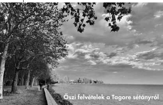
Őszi felvételek a Tagore sétányról