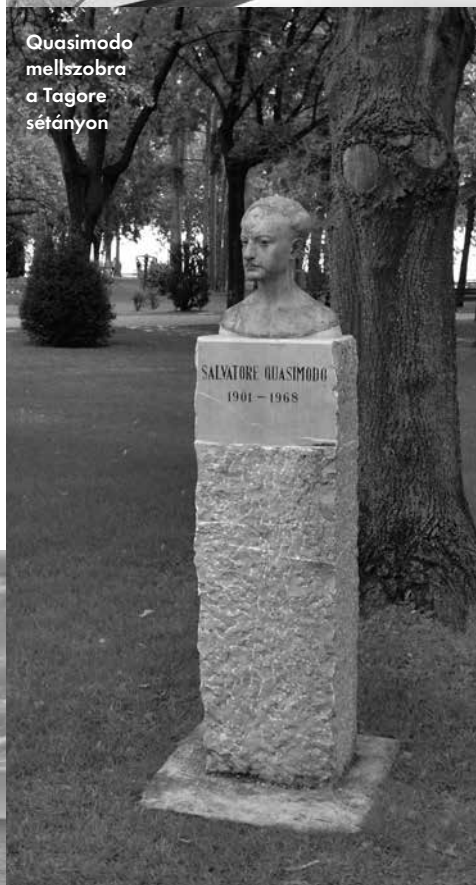
Quasimodo mellszobra a Tagore sétányon