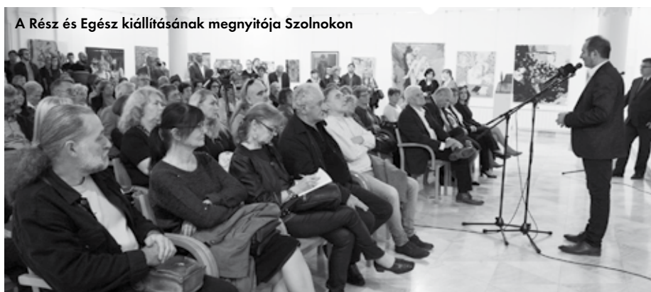
A Rész és Egész kiállításának megnyitóját Szolnokon

SZ olnok, az alföldi festészet patinás bölcsője a nagy múltú, immár száztizenhat éves művészteleppel és a körülötte csoportosuló képzőművészekkel, rangos színházával, kiállítótermeivel, rendezvényeivel már nem csak regionális központ, hanem az ott élő és dolgozó művészek, művészeti vezetők és városatyák egy cél felé mutató összefogásának, a fiatal generáció felkarolásának köszönhetően mára már országos jelentőségű kulturális és művészeti centrummá nőtte ki magát. A szolnoki kulturális események visszhangja elérte a nagy országos és fővárosi művészeti fellegrákokat is, s többé már nem a provincia megnyilvánulásának, hanem színvonalas élményeket jelentő, fontos kulturális eseménynek számít egy-egy szolnoki tárlat, színházi premier, művészeti ünnep vagy fesztivál.