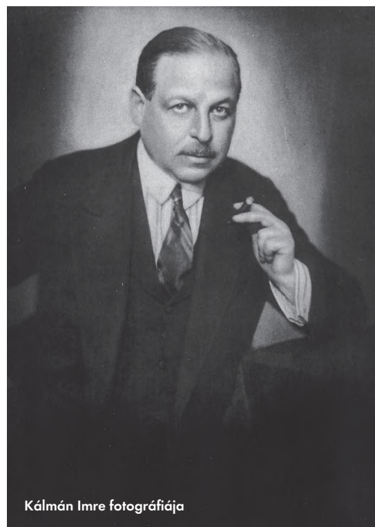
Kálmán Imre fotográfiaja

mányosan kék egyenruhát viselő Hoch- und Deutschmeisterek zenekarának előadásában.