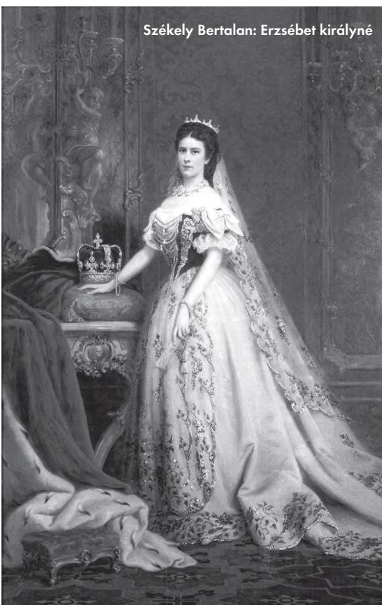
Székely Bertalan: Erzsébet királyné

Kisfaludy és Szigligeti mellett olyan, mára részben elfelejtett szerzők – ma is ismert című – műveit adták elő, mint Csepreghy Ferenc (1842–1880; például a Strogoff Mihály , amely a legtöbb előadást megélt, magyar szerző írta darab volt); Csiky Gergely (1842–1891; például A nagymama ), a már említett Dóczi (Dux) Lajos (például a Csók , óriási sikerrel); Gaál József (1811–1866; a Peleskei nótárius , erősen átalakítva); Gabányi Árpád (1855–1915; Az apósok ); Gerő Károly (1856–1904; Próbaházasság ); Jókai Mór (például Az arany ember ); Karczag Vilmos (1859–1923; Lemondás ); Murai Károly (1857–1933; Huszárszerelem ); Szigeti József (1822–1902; a Vén bakancsos , az aradi színtársulat magyar nyelvű előadásában); Tóth Ede (1844–1876; A falu rossza ). Az igazán jelentős magyar drámák közül egyedül Madách Imre (1823–1864) Az ember tragédiáját mutatták be 1892 júniusában az Ausstellungstheaterben, Dóczi fordításában, kedvező fogadtatással és kritikákkal. Az elő-