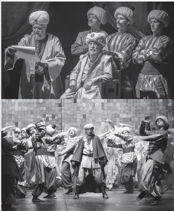
Jelenetfotók az Egri csillagok előadásából