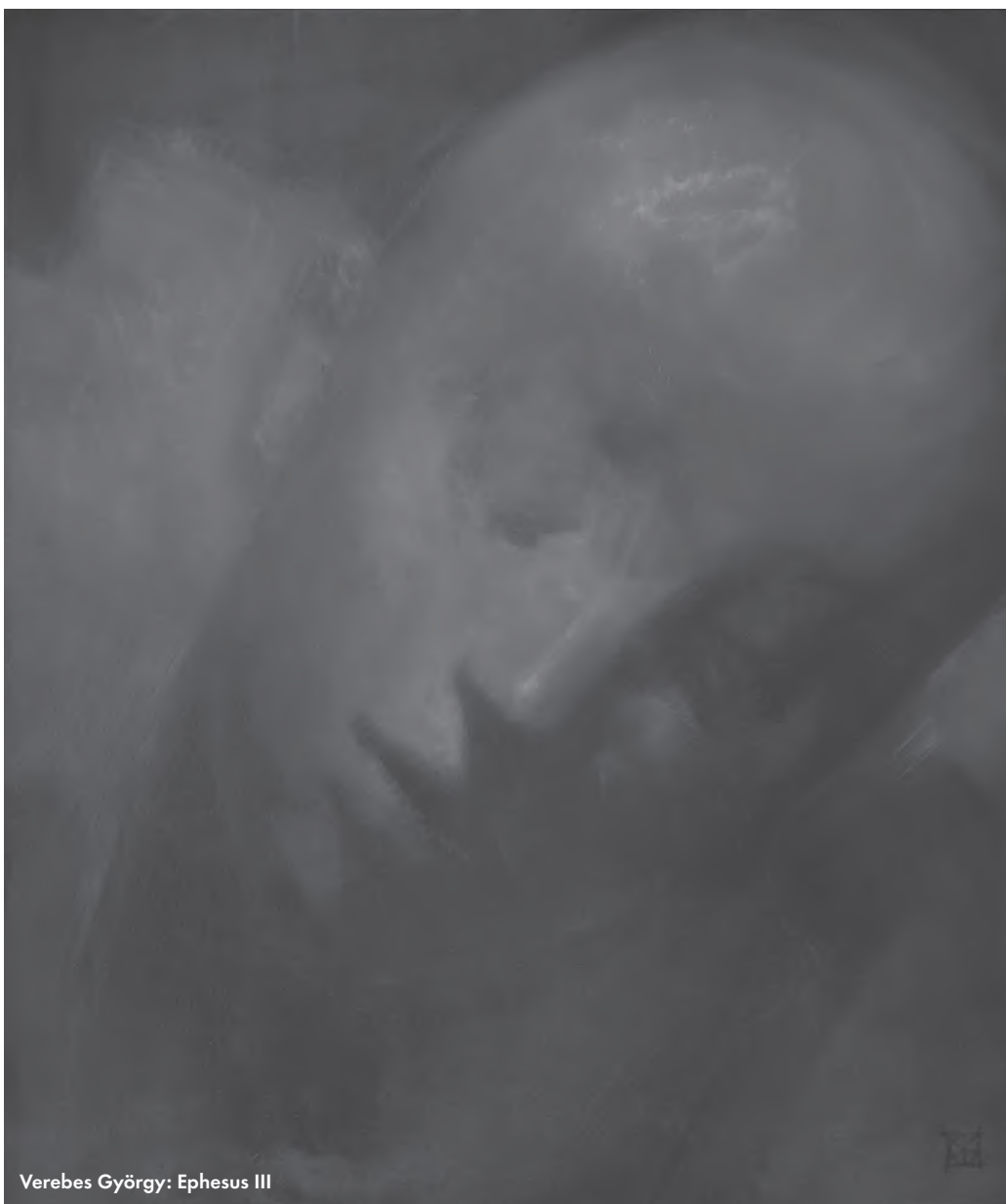
Verebes György: Ephesus III

– Dugja el azonnal ezt a négy szövetet! – hadarta és az orvos karjára nyomta az anyagokat.