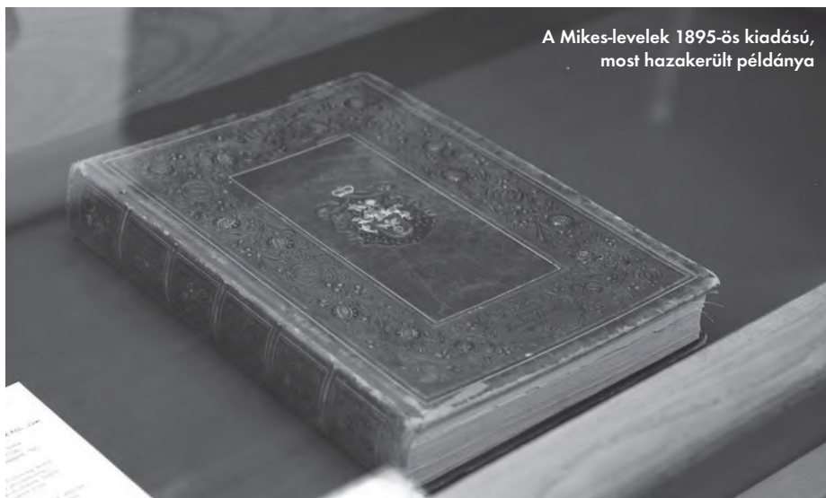
A Mikes-levelek 1895-ös kiadása, most hazakerült példánya