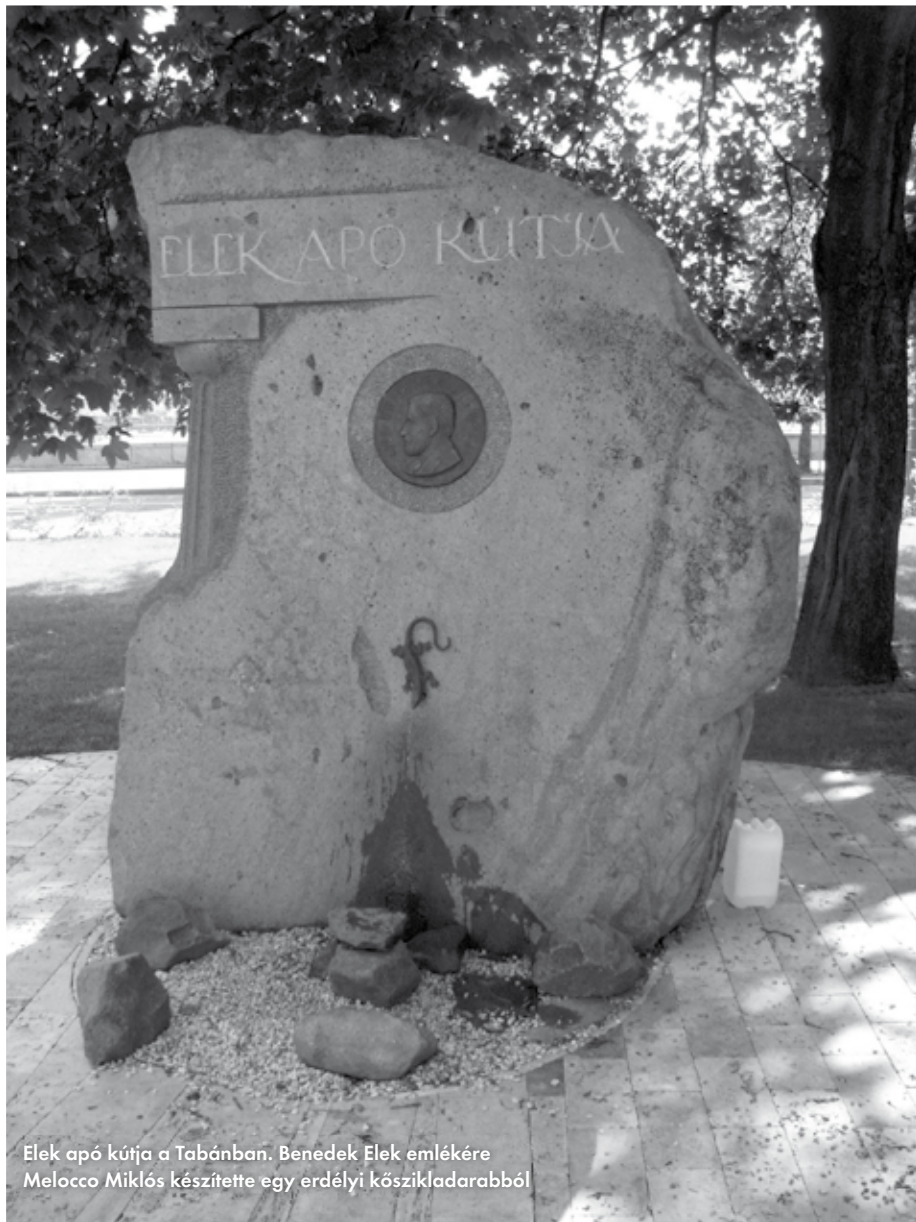
Elek apó kútja a Tabánban. Benedek Elek emlékére Melocco Miklós készítette egy erdélyi kőszikladarabból

A népmesék gyűjtésben, feldolgozásában el-