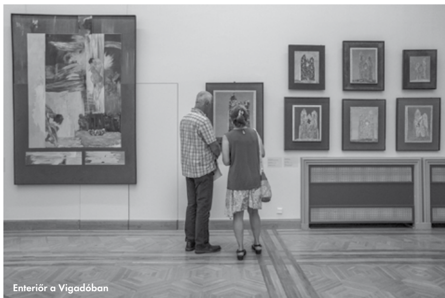
Enteriőr a Vigadóban