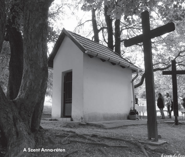
A Szent Anna-réten