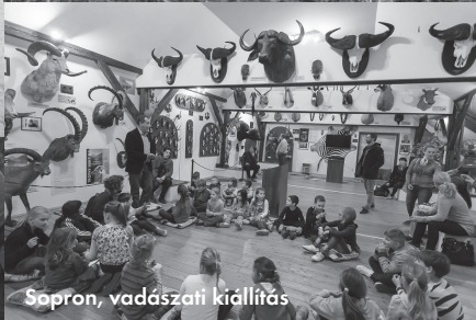
Sopron, vadászati kiállítás