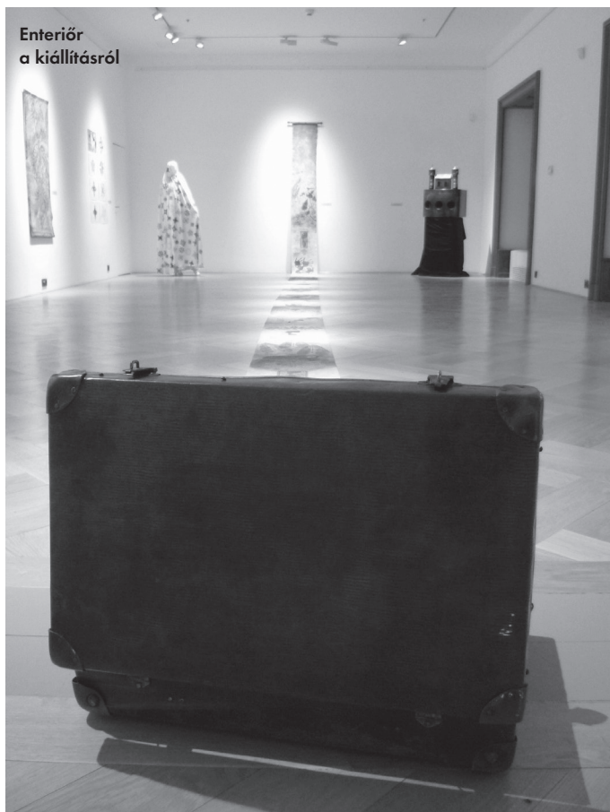
Enteriőr a kiállításról