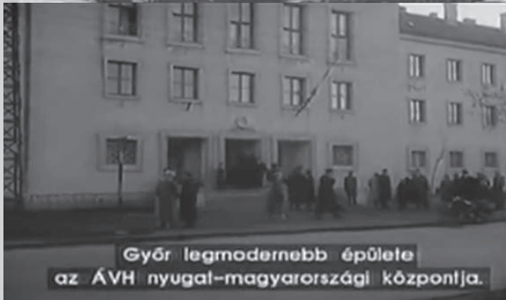
Győr legmodernebb épülete az ÁVH nyugat-magyarországi központja.