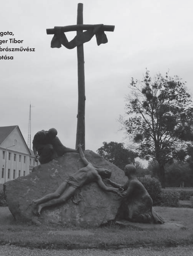
Golgota, Rieger Tibor szobrászművész alkotása

a ravatalon, gyönyörű, melegbársony szeméből a kicsorduló könnyet a hosszú, fekete szempillák nem takarták el. A félig nyitott szájából a fogak gyöngysora egy új, megismert világra mosolygott, ahová csak a kiválasztottak léphetnek be.