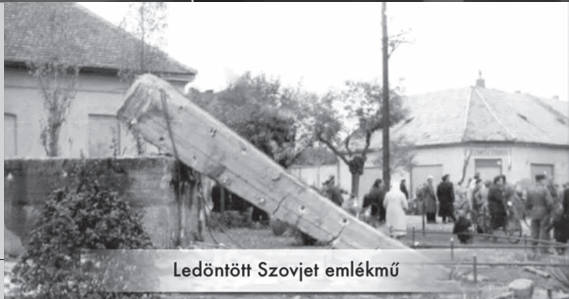
Ledöntött Szovjet emlékmű

Győri dokumentumképek 1956-ból eredeti feliratokkal