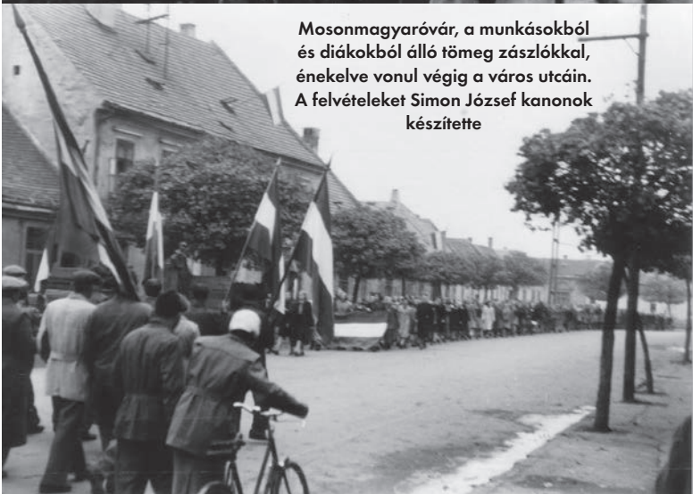
Mosonmagyaróvár, a munkásokból és diákokból álló tömeg zászlókkal, énekelve vonul végig a város utcáin.