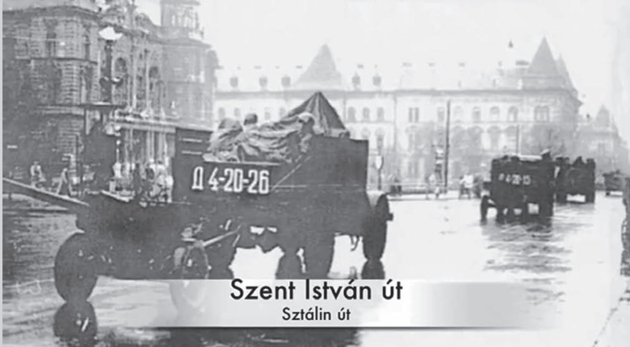
Szent István út Sztálin út