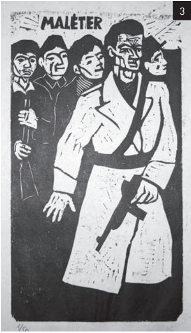
1. Pázmándy István: Parlament (3.), 1956 2. Dávid Kiss Mária: Félelem (Angst), 1959 3. Veress Pál: Maléter, 1956 4. Nagy Éva: Arcok a lágerben (10.), 1959 5. Baranyay András: 1956/3. (Halottak a Kossuth téri vérengzést követően) 6. Marosán Gyula: Az első zsákmányolt orosz tank, 1957