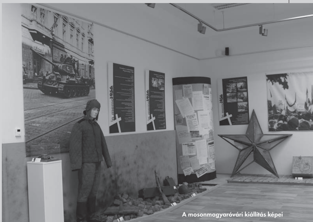
A mosonmagyaróvári kiállítás képei

A tárlat nem csupán a forradalom napjait, hanem az ötvenes éveket is átfogóan bemutatja, azt, hogy miként hatolt be az emberek magánéletébe a kommunista propaganda. Ezt szemlélteti az ötvenes évek oktatási módszere is az úttörőmozgalom dokumentumain és korabeli könyveken keresztül. A vitrinekbe sztahanovista oklevelek és a munkaverseny dokumentumai kerültek, de herendi Sztálin-