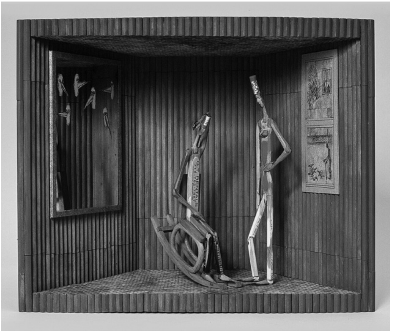
Ceruzadoboz (2001, laminált ceruzák, vegyes technika), Fotó: Greg Stanger

adásul még a kiegyenlítődsre is utal, akkor a szobor „története” éppolyan humoros, mint amilyen drámai. Egyszerre, anélkül, hogy egyik kioltaná a másikat. És így a szabadság érzetét is sugallja e mű. Böröcz egyfelől a mű valamennyi elemének narratív értelmet ad, másfelől azonban mégsem ragaszkodik hozzá, hogy a néző fantáziáját feltétlenül egyetlen irányba terelje.