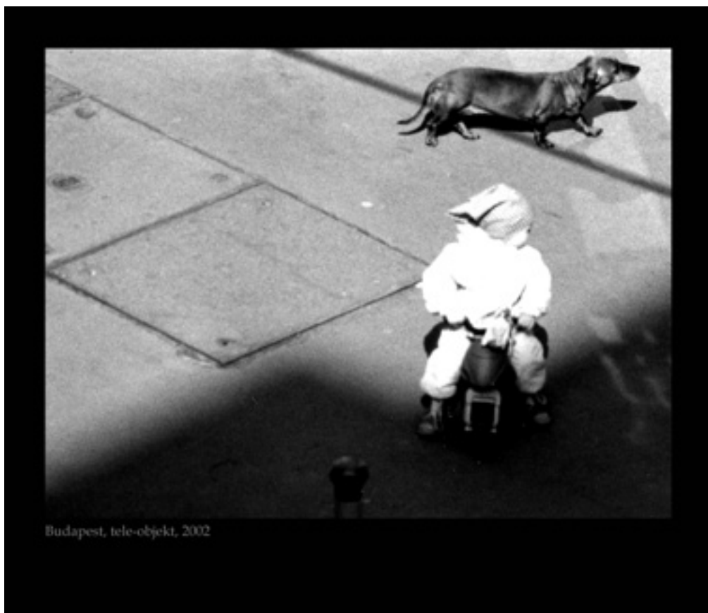
Budapest, tele-objekt, 2002