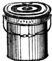
Szobakloset vödör alakban.