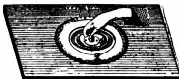
Ülődeszka kloset és nyílt árnyékszékek részére.

u. m. zsebvendélek, korsók, tűzfődények stb. nagyrészt kézzel készített, szabott gyári áruk mellett.