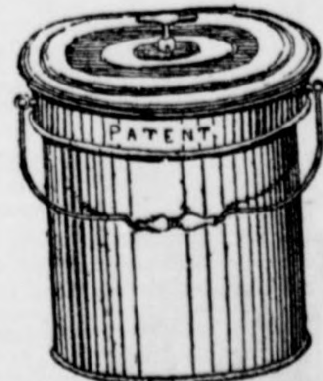
Szobakloset vödör alakban.