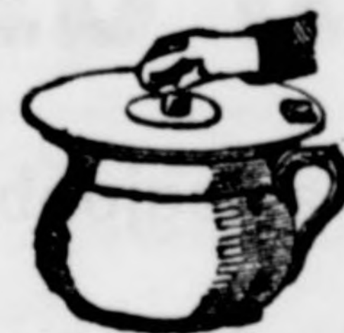
Pod de chambre.