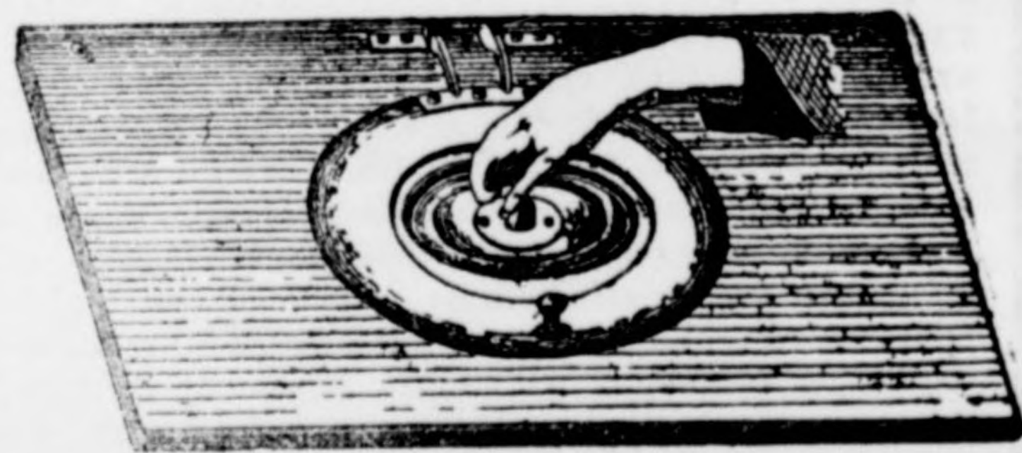
Ülődeszka klos és nyílt árnyékszékek részére.