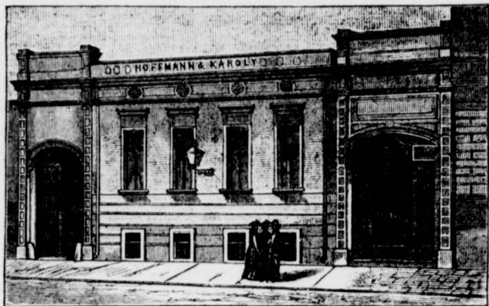
óposta-utca 14. szám.

készít és szállít az épület- és butor-szakmába vágó mindenemű fa-munkákat a legjobb minőségű anyagból, állandó, gyakorlott munkásokkal és a legjobb gépekkel.