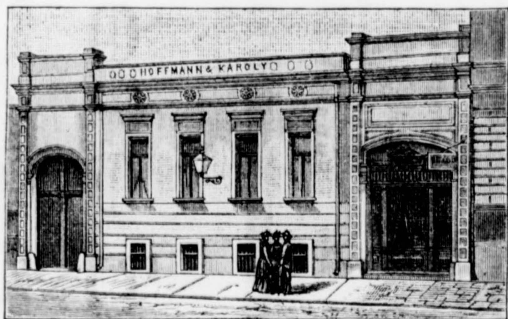
óposta-utca 14. szám.

készít és szállít az épület- és butor-szakmába vágó mindenemű fa-munkákat a legjobb minőségű anyagból, állandó, gyakorlott munkásokkal és a legjobb gépekkel.