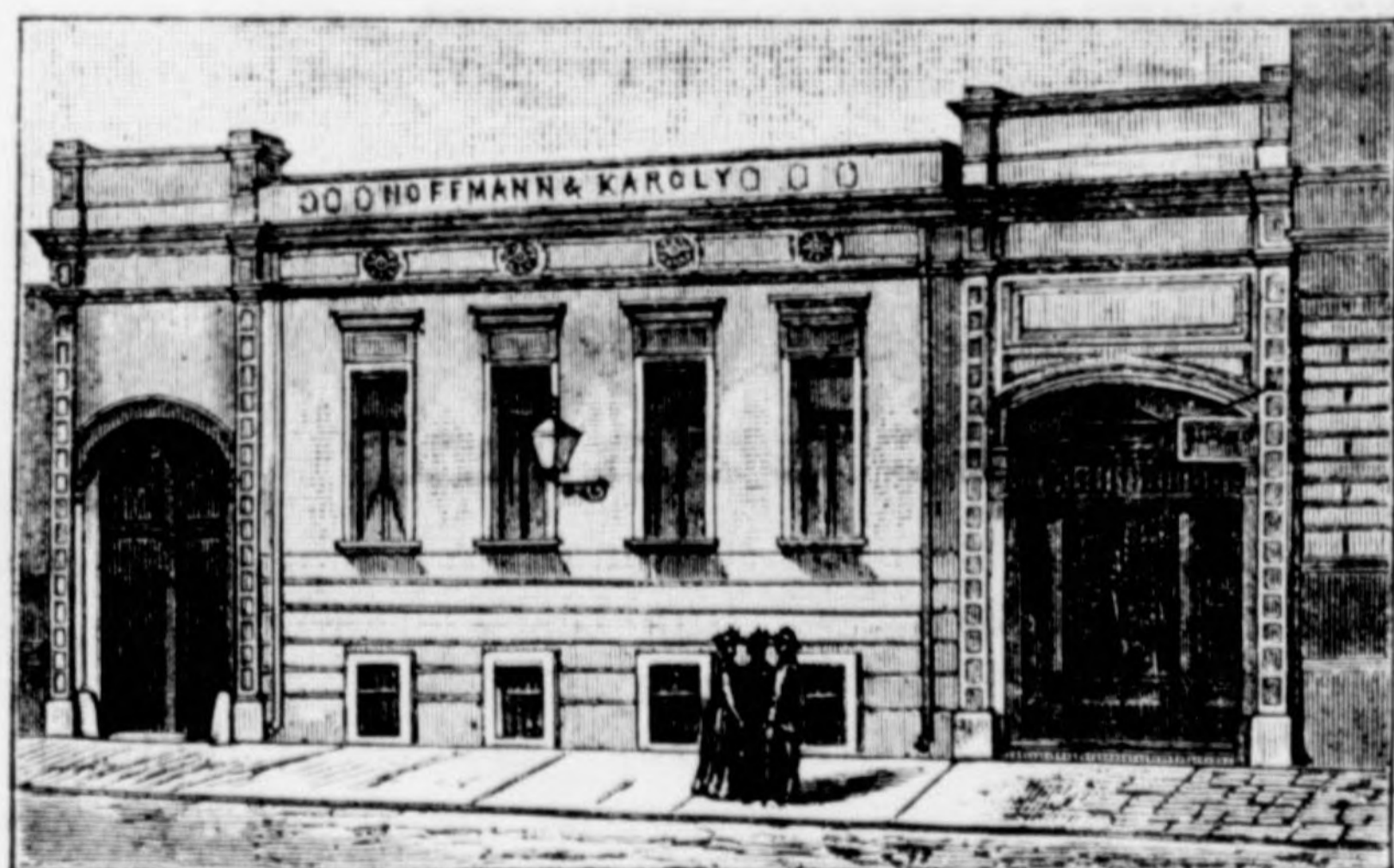
óposta-uteza 14. szám.

készít és szállít az épület- és butor-szakmába vágó mindenemű fa-munkákat a legjobb minőségű anyagból, állandó, gyakorlott munkásokkal és a legjobb gépekkel.