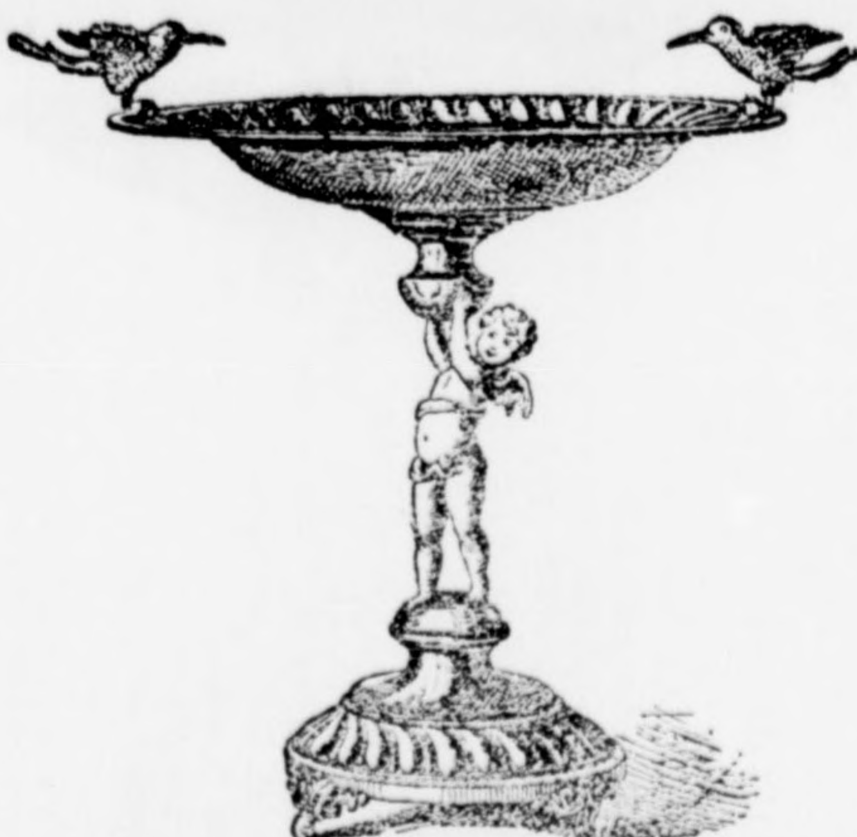
Gyümölcstartó-állvány 12 frt.