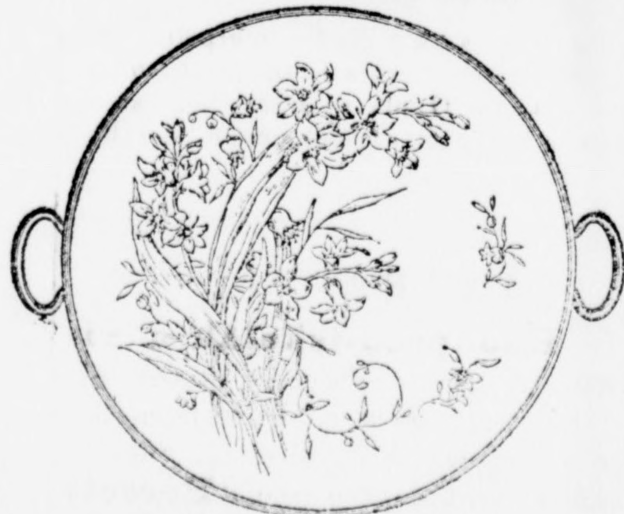
Tortatálczák a legszebben kiállítva, gazdag választékban 4 frttől 10 frtig.