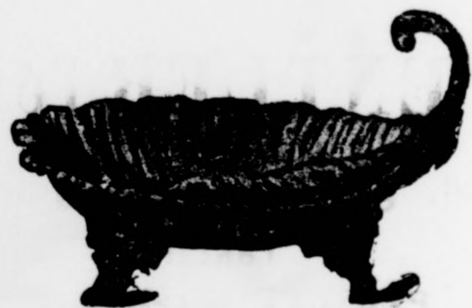
Gyümölcskosár kagylóalakban gazdagon aranyozva 14 frt.