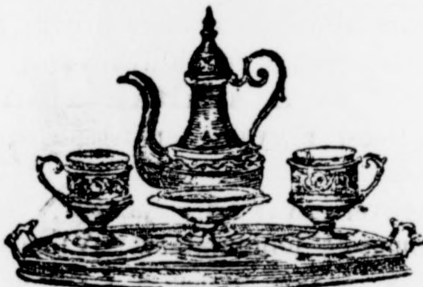
Mocca-készlet legszebben kidolgozva 14 frt.