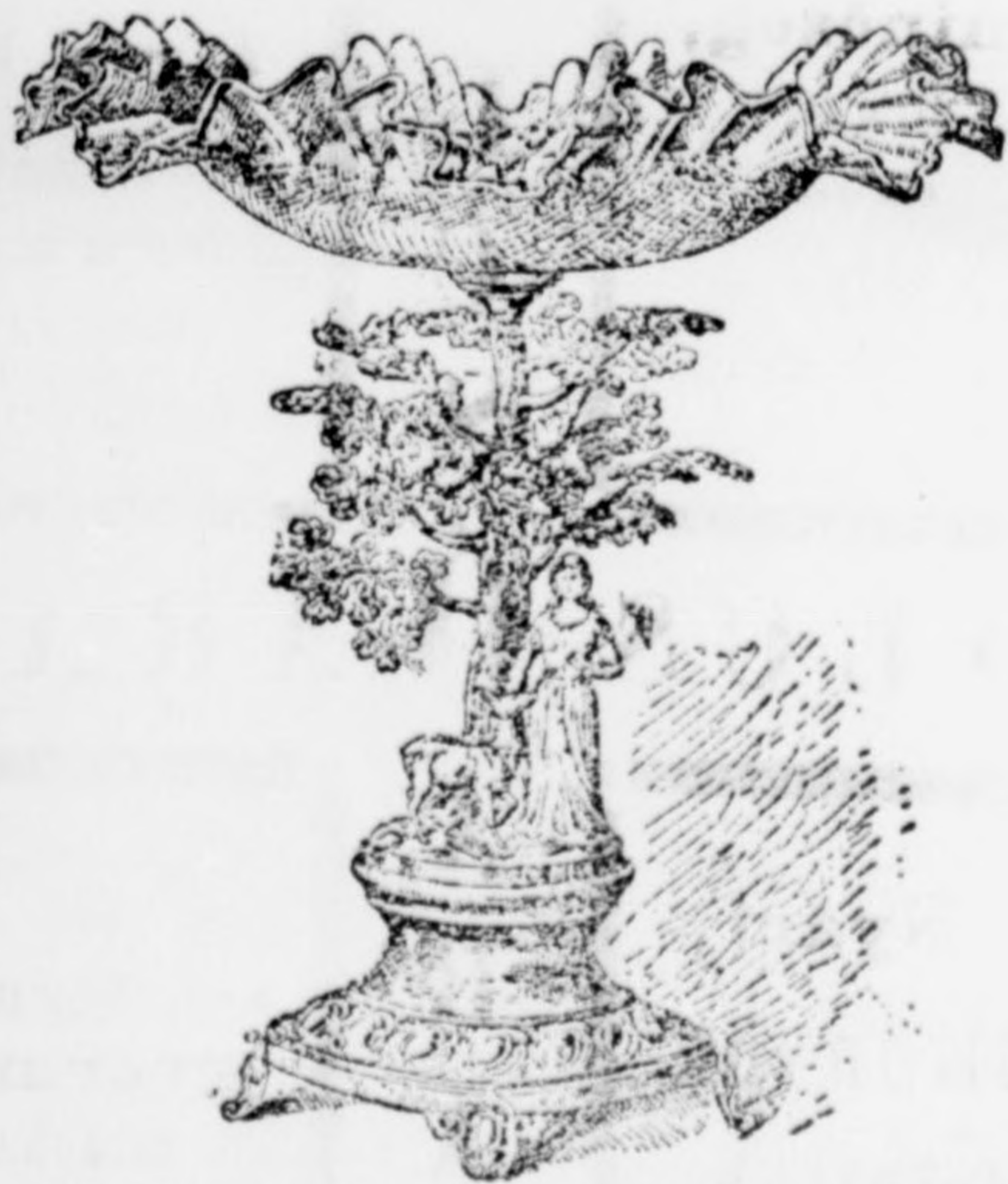
Gyümölcs állvány 30–40 cm-t. magas a legszebben dolgozva 12 frt.