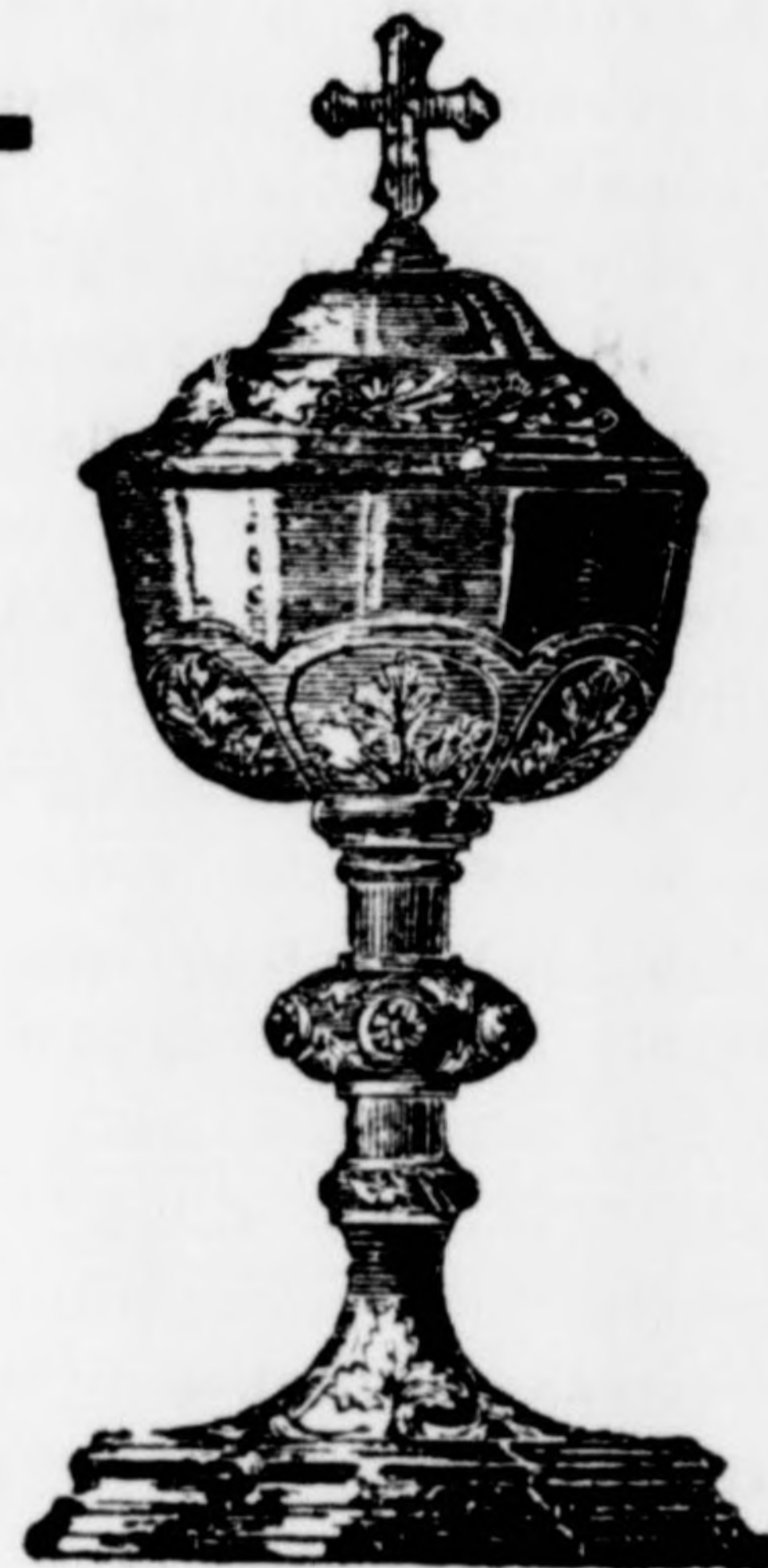
Templomi kelyhek 12 frtől 60 frtig.]