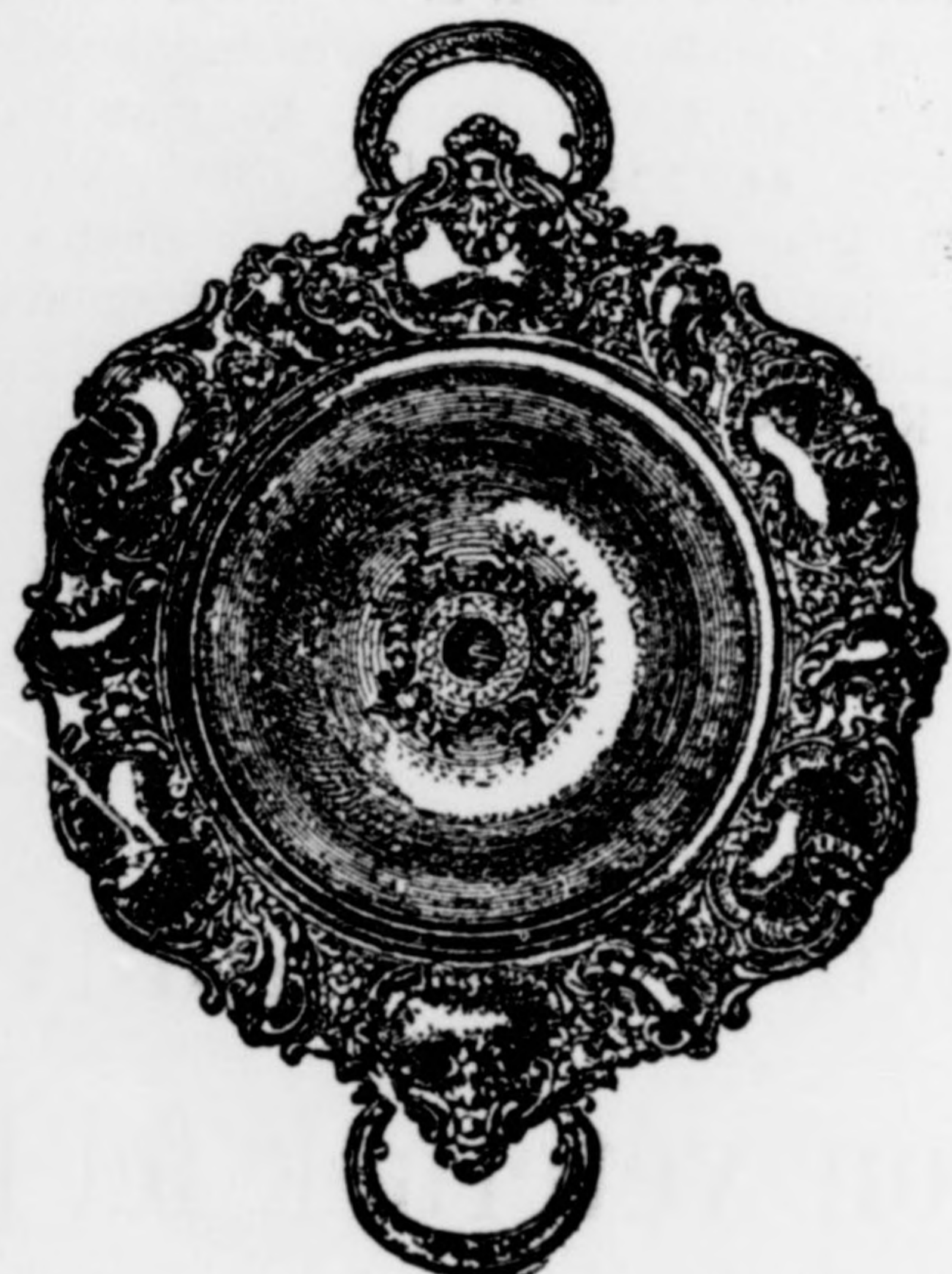
Kenyérkosár gazdagon vésve diszaranyozással 7 frt.

órák és aranyműves város épület, király fő-utca.