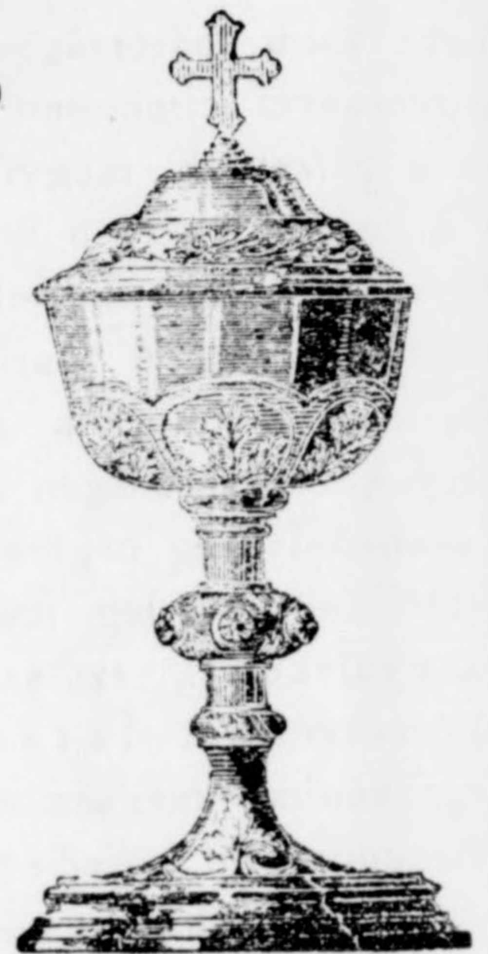
Templomi kelyhek. 12 frttól 60 frtig