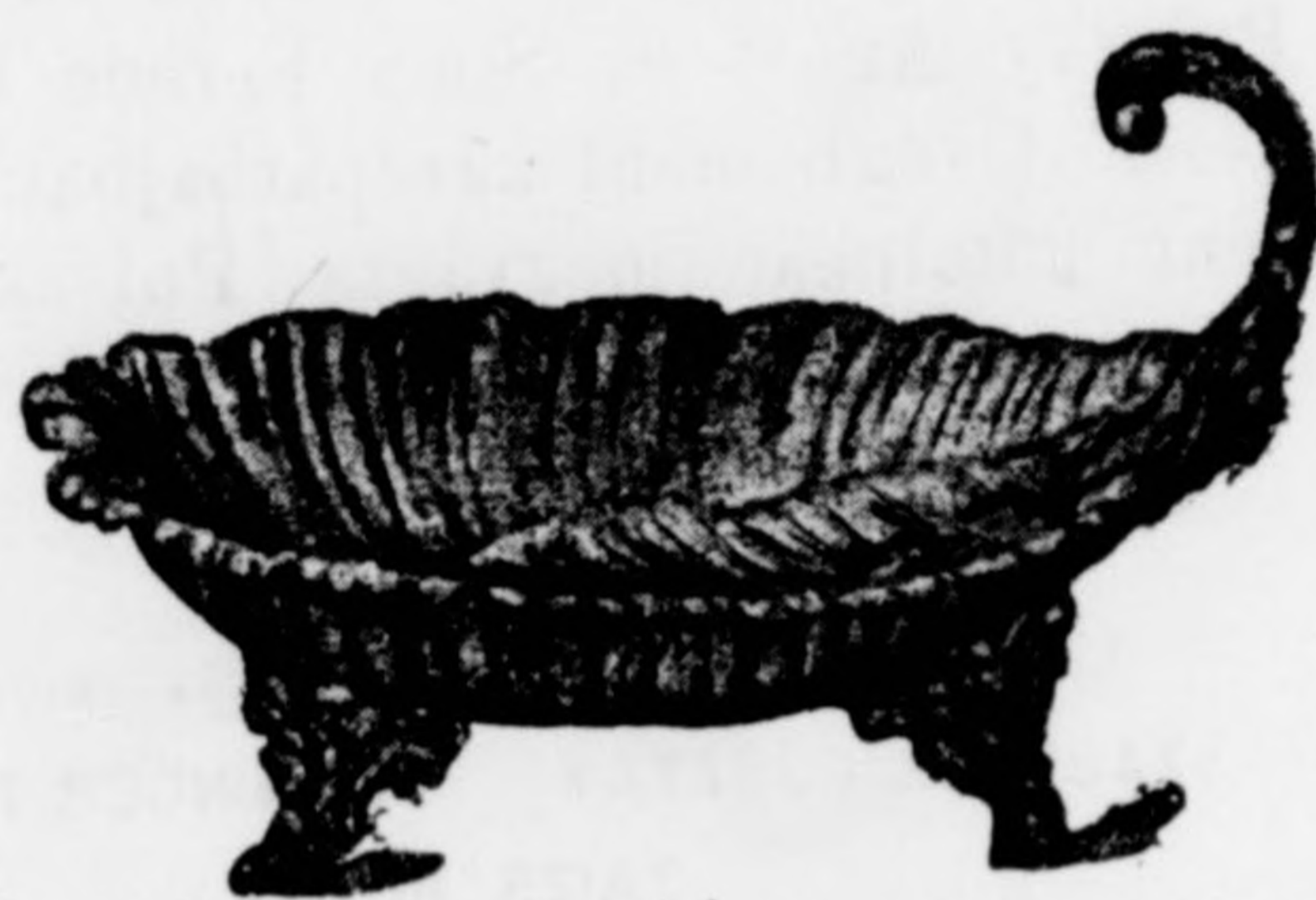
Angol nevjegytartó auzan aranyozva barocc véséssel 6 frt.