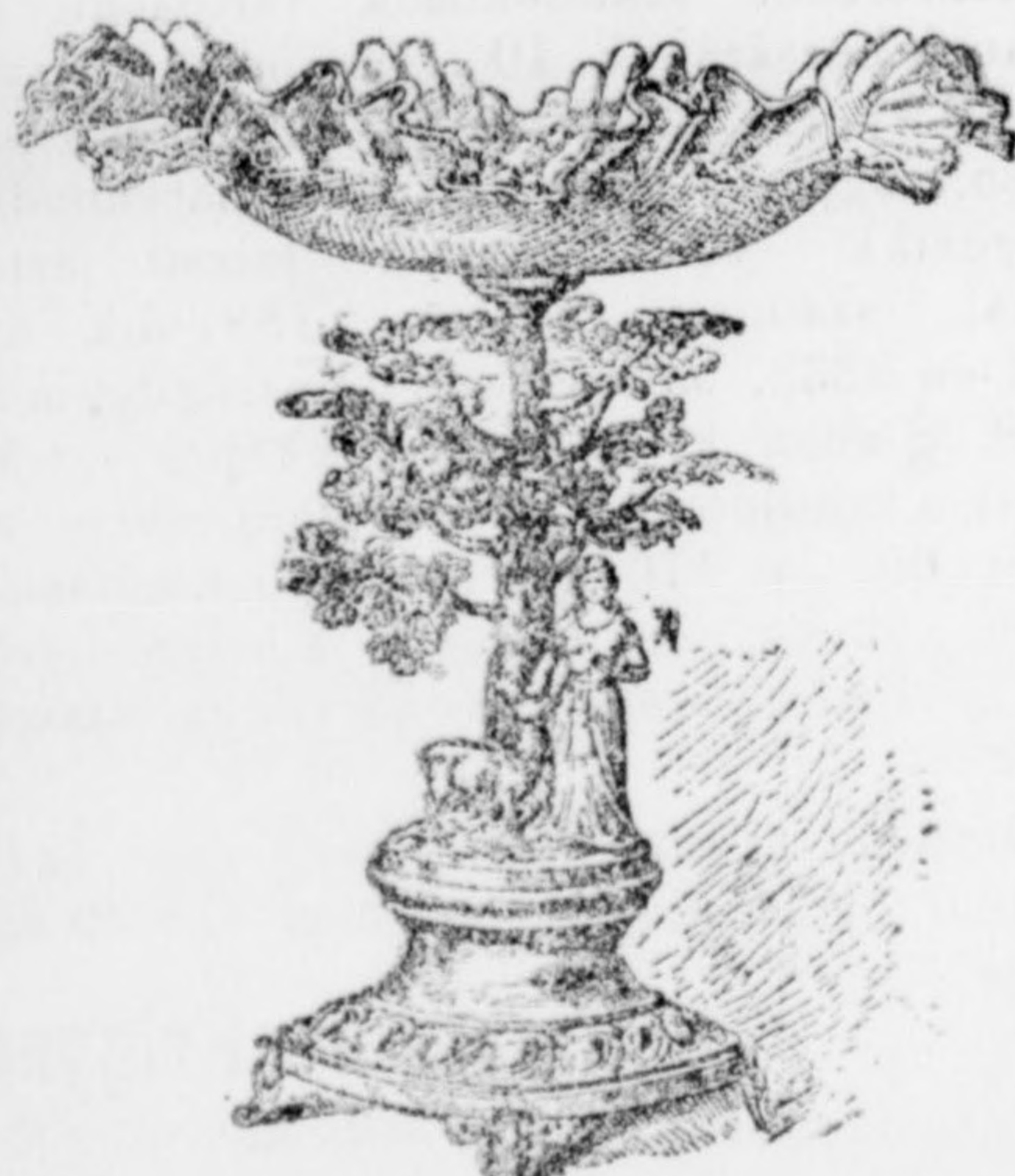
Gyümölcs állvány 30-40 cm-t. ma- gas a legszebben dolgozva 12 frt.