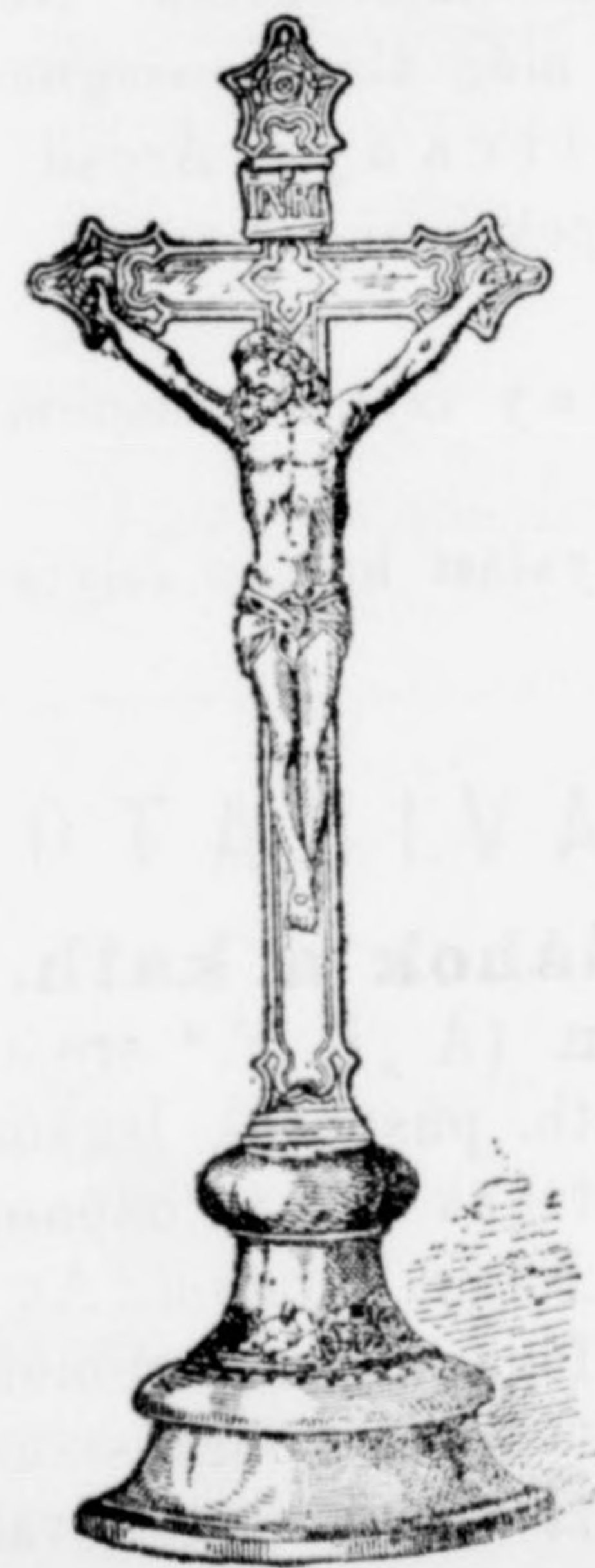
Feszület tartós és csinos kivi- telben 10 frt.