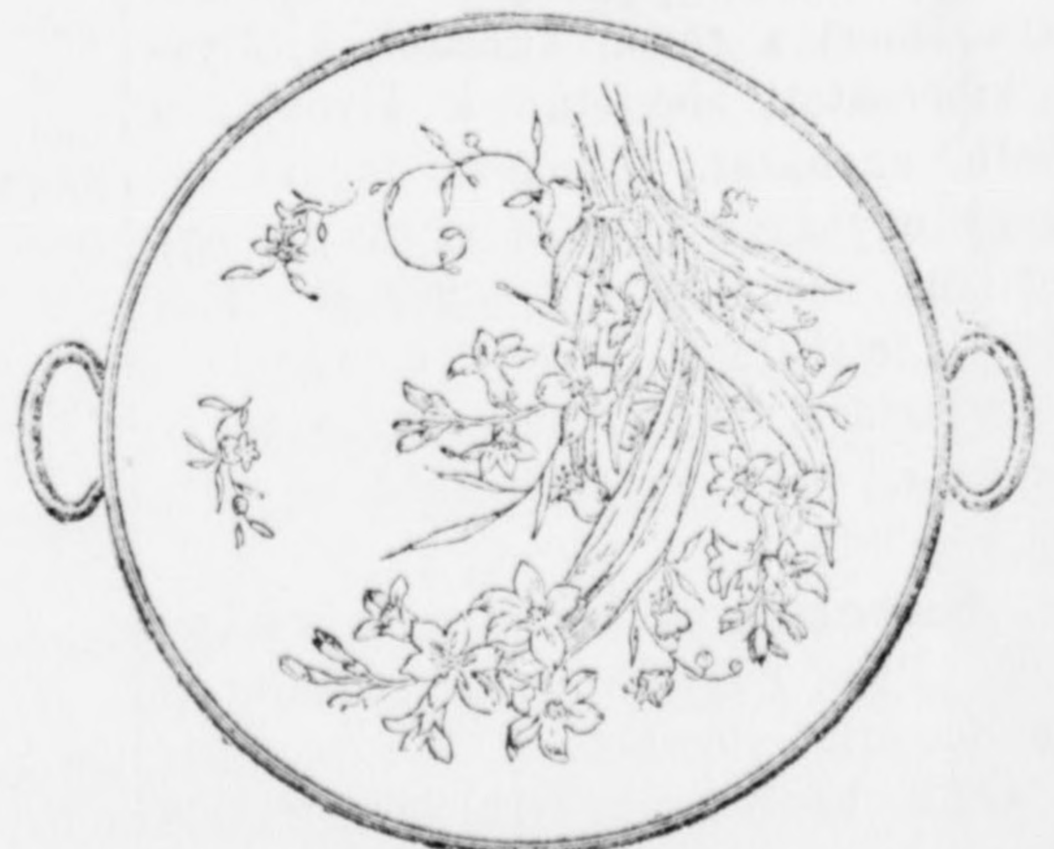
Tortafélezák a legszebben kiállitva, gazdag választékban 4 frttól 10 frtig.