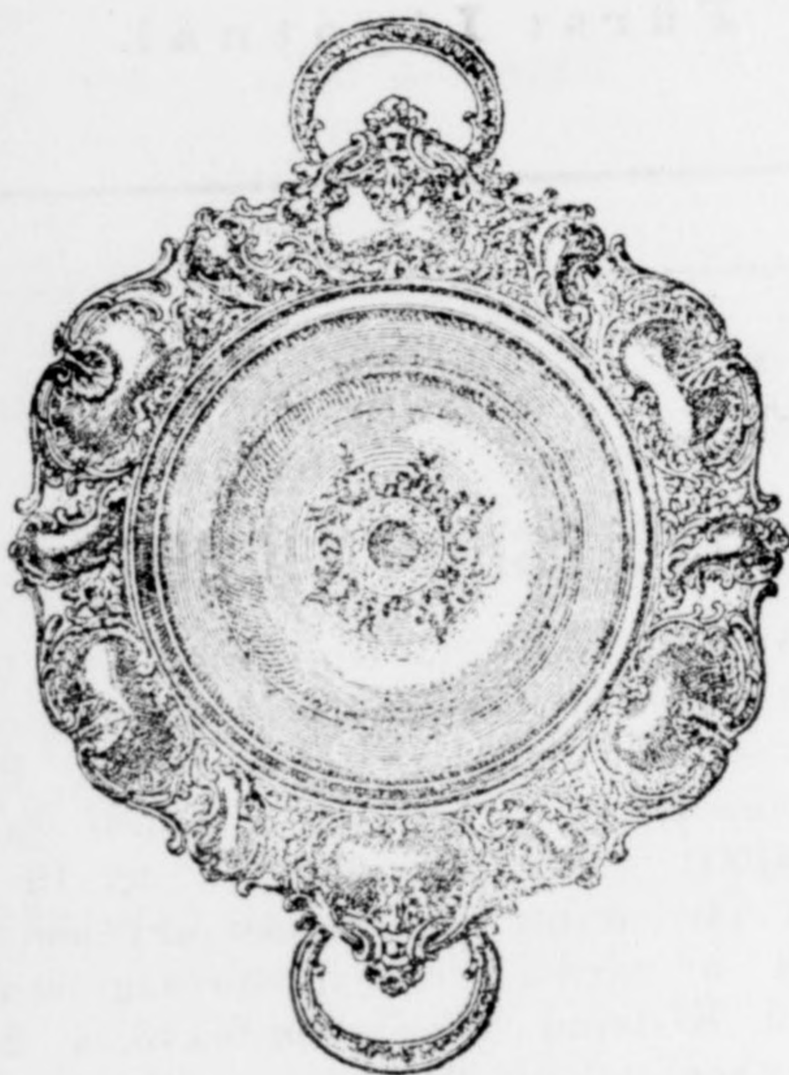
Kenyérfosár gazdagon vésve disz- aranyozással 7 frt.

órák és aranyműves város épület, király fő-utca.