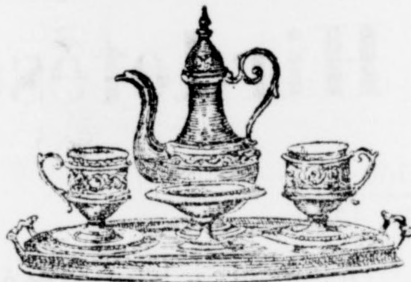
Mocca-készlet legszebben kidolgozva 14 frt.