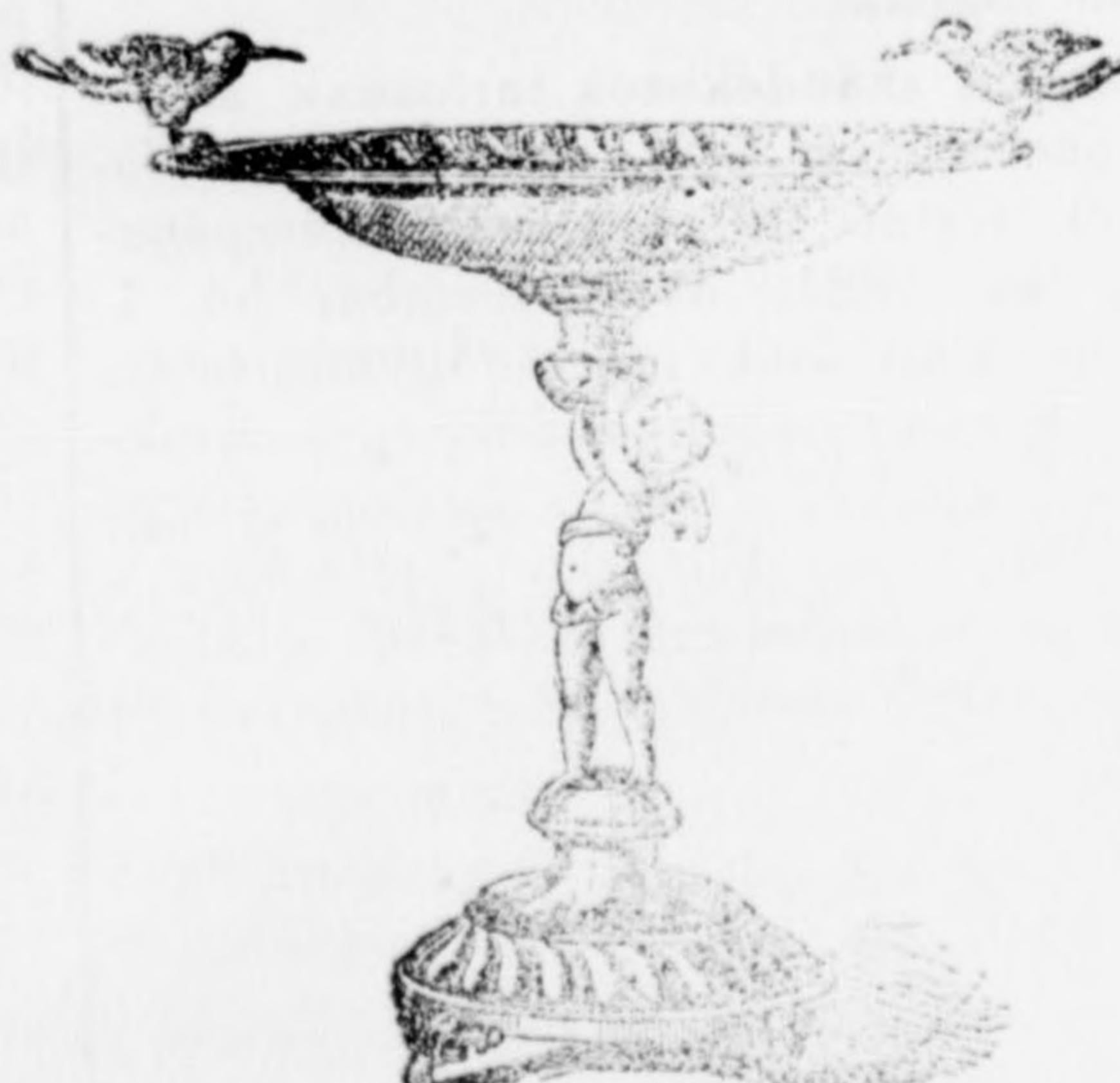
Gyümölestartó-állvány 12 frt.