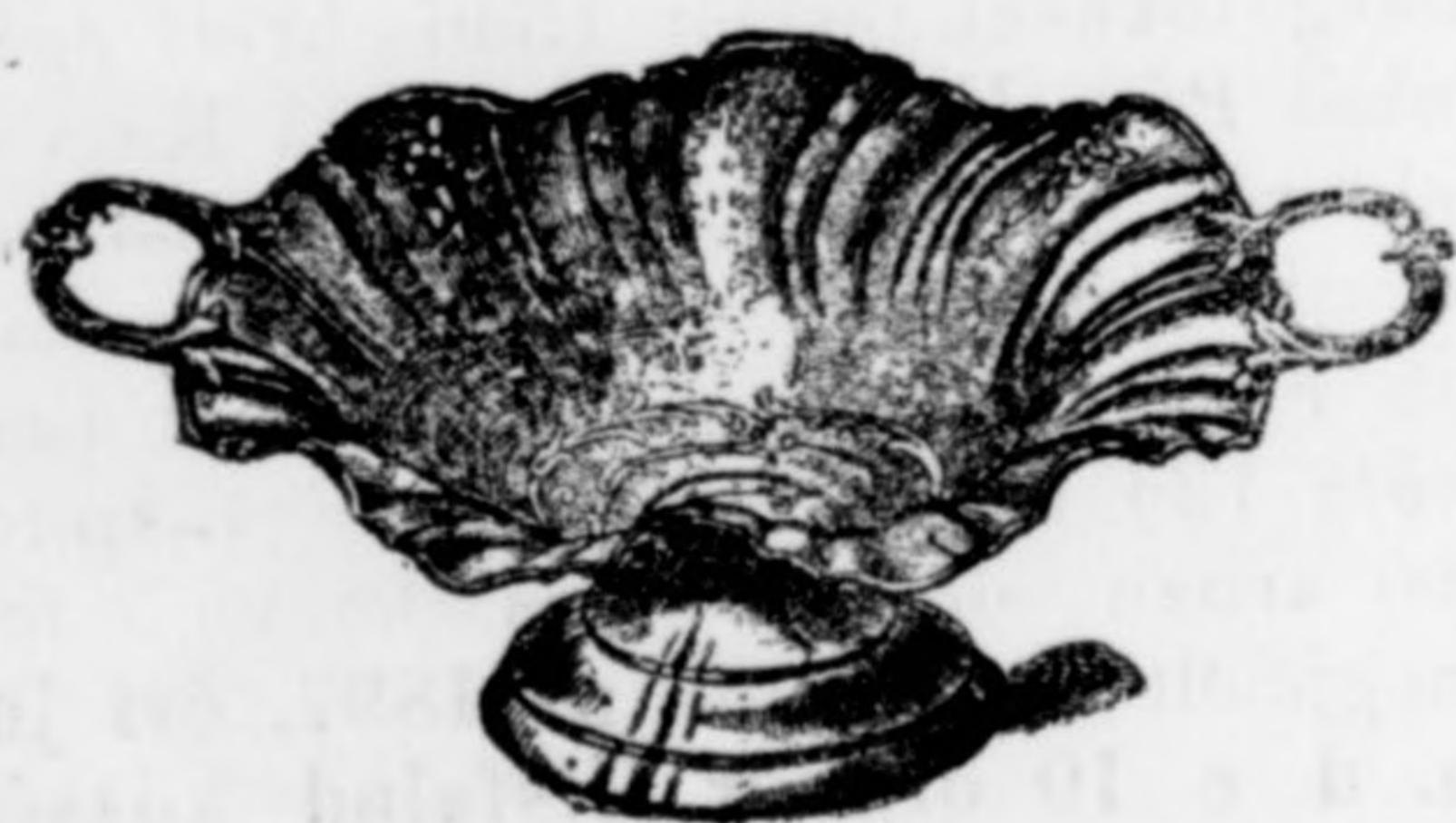
Gyümölcskosár kagylóalakban gaz- dagon aranyozva 14 frt.