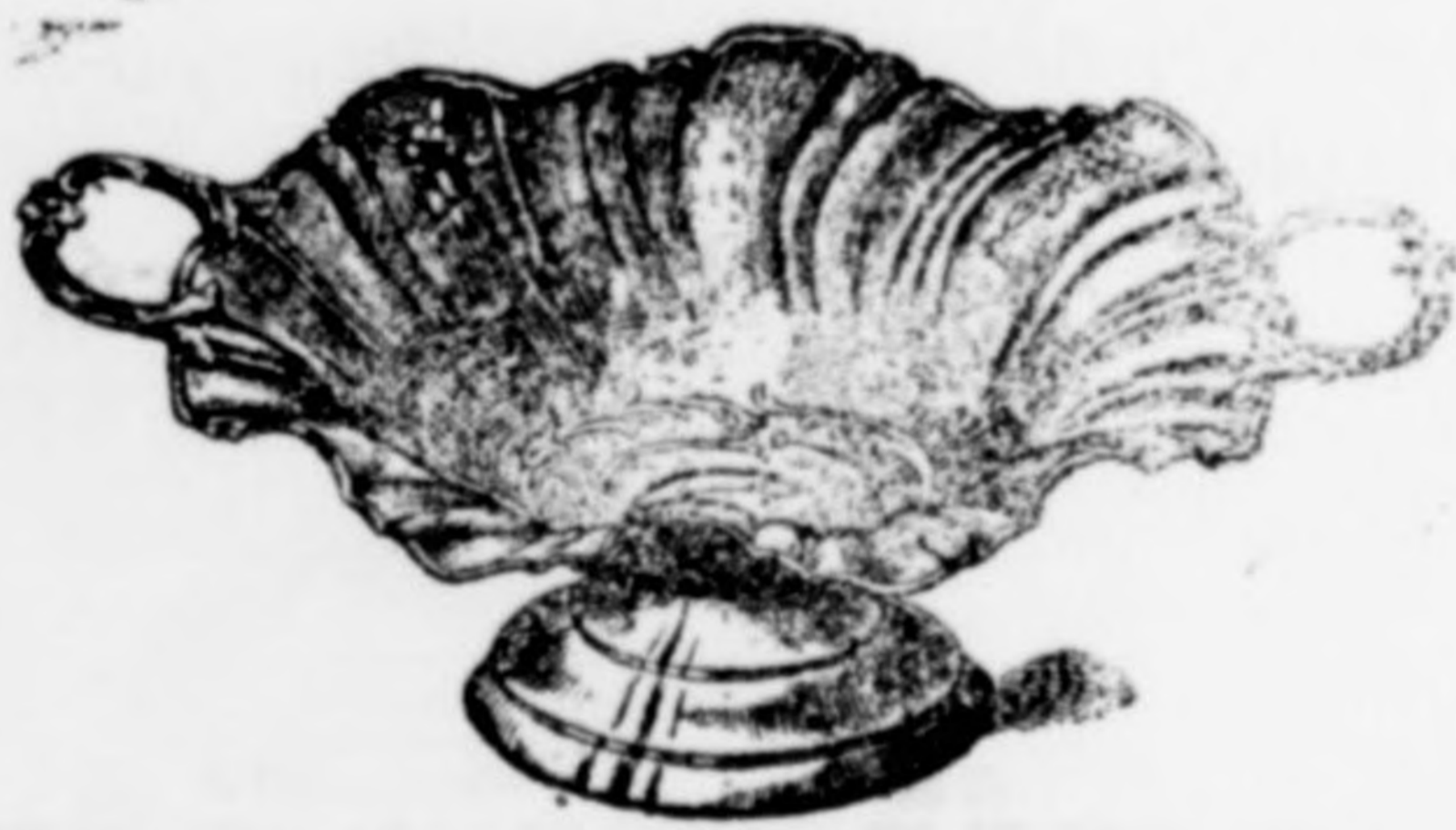
Gyümölcskosár kagylóalakban gazdagon aranyozva 14 frt.