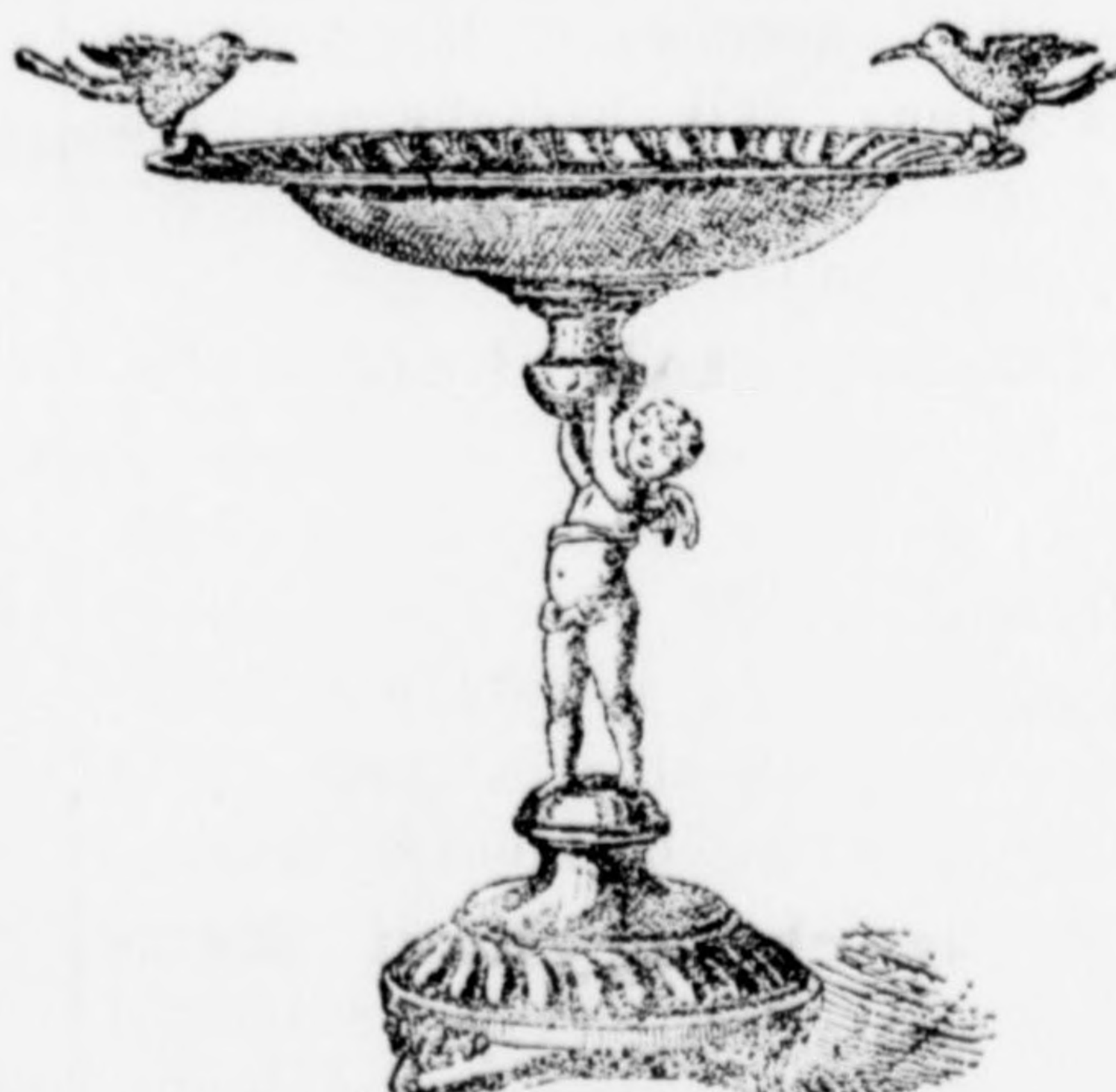
Gyümölcstartó-állvány 12 frt.