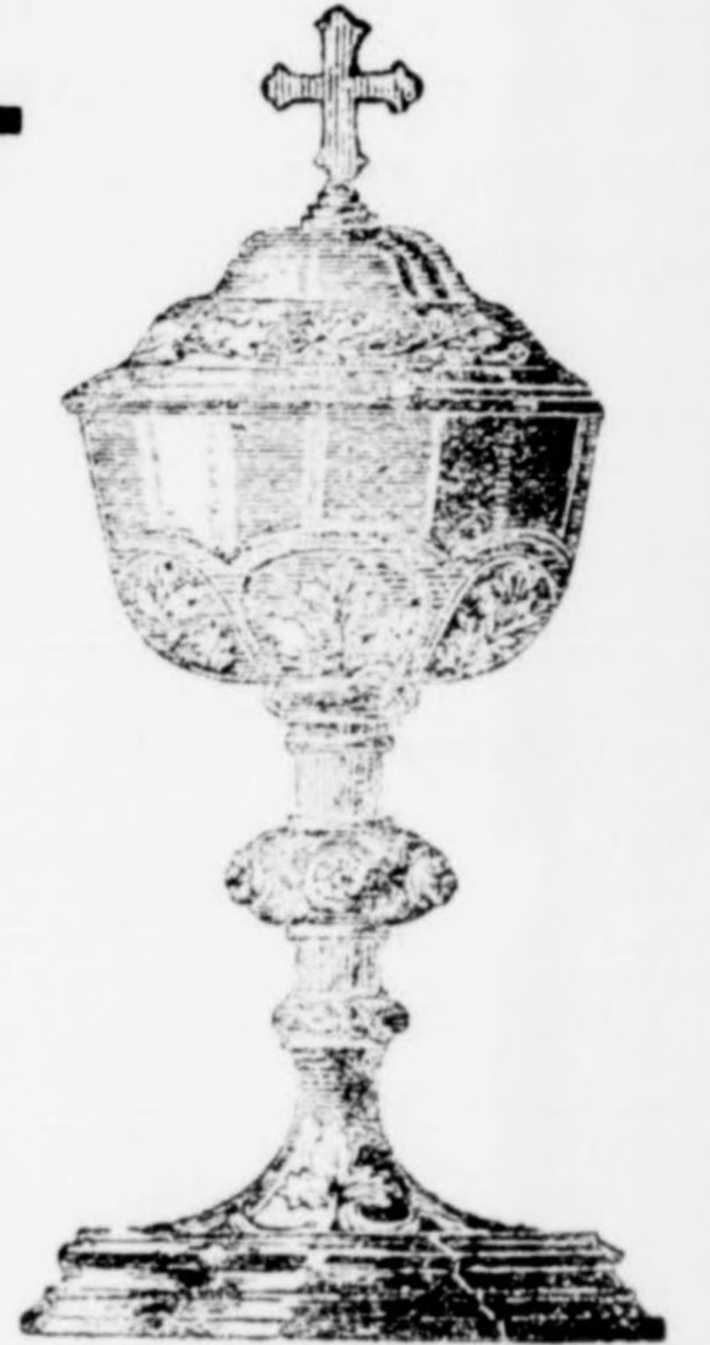
Templomj kelyhek 12 frttól 60 frtig.