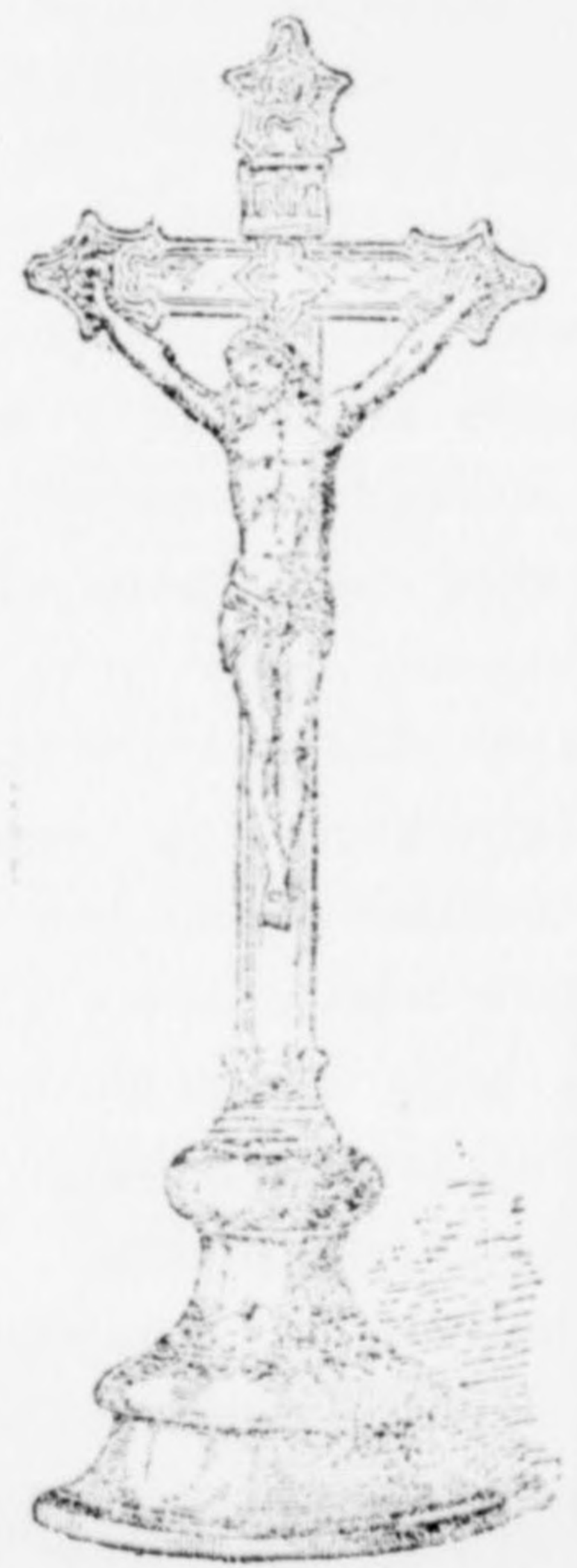
Feszület tartós és csinos kivitelben 10 frt.