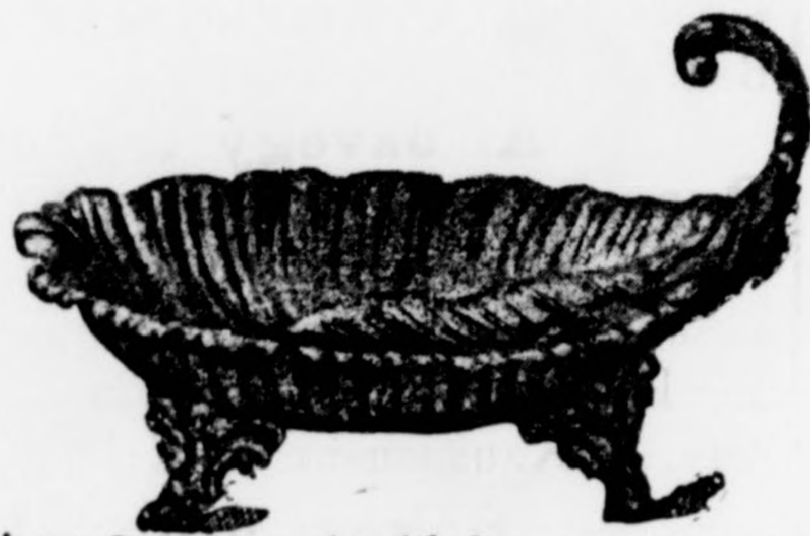
Angol névjegy tartó dusan aranyozva barocc véséssel 6 frt.