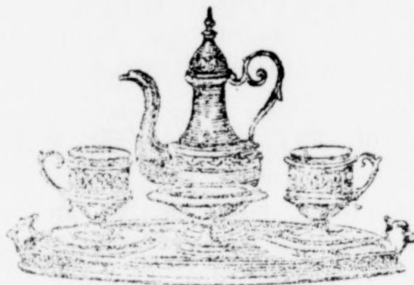
Mocca készlet legszebben kidolgozva 14 frt.