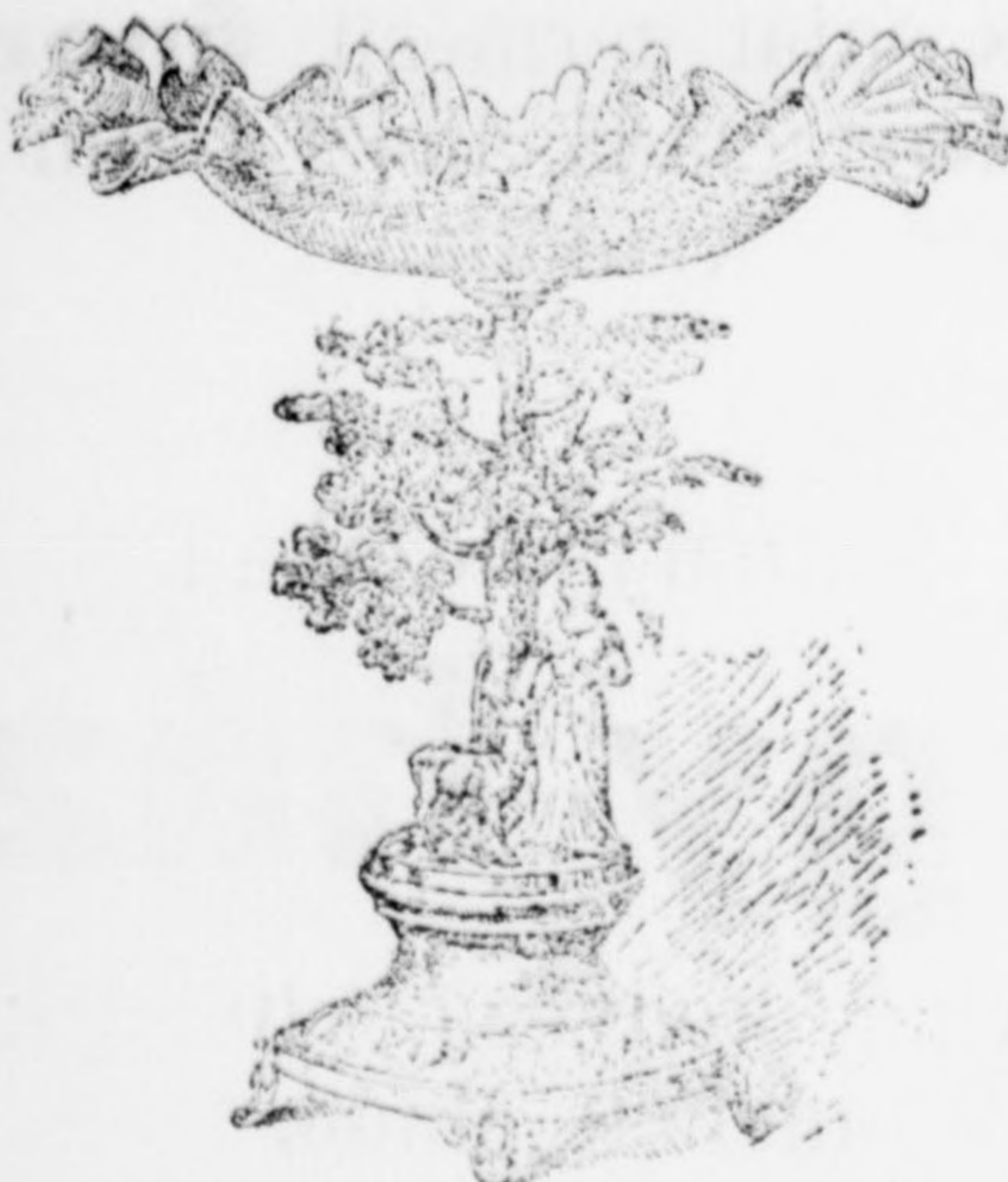
Gyümölcs állvány 30 - 40 ctmt. magas a legszebben dolgozva 12 frt.