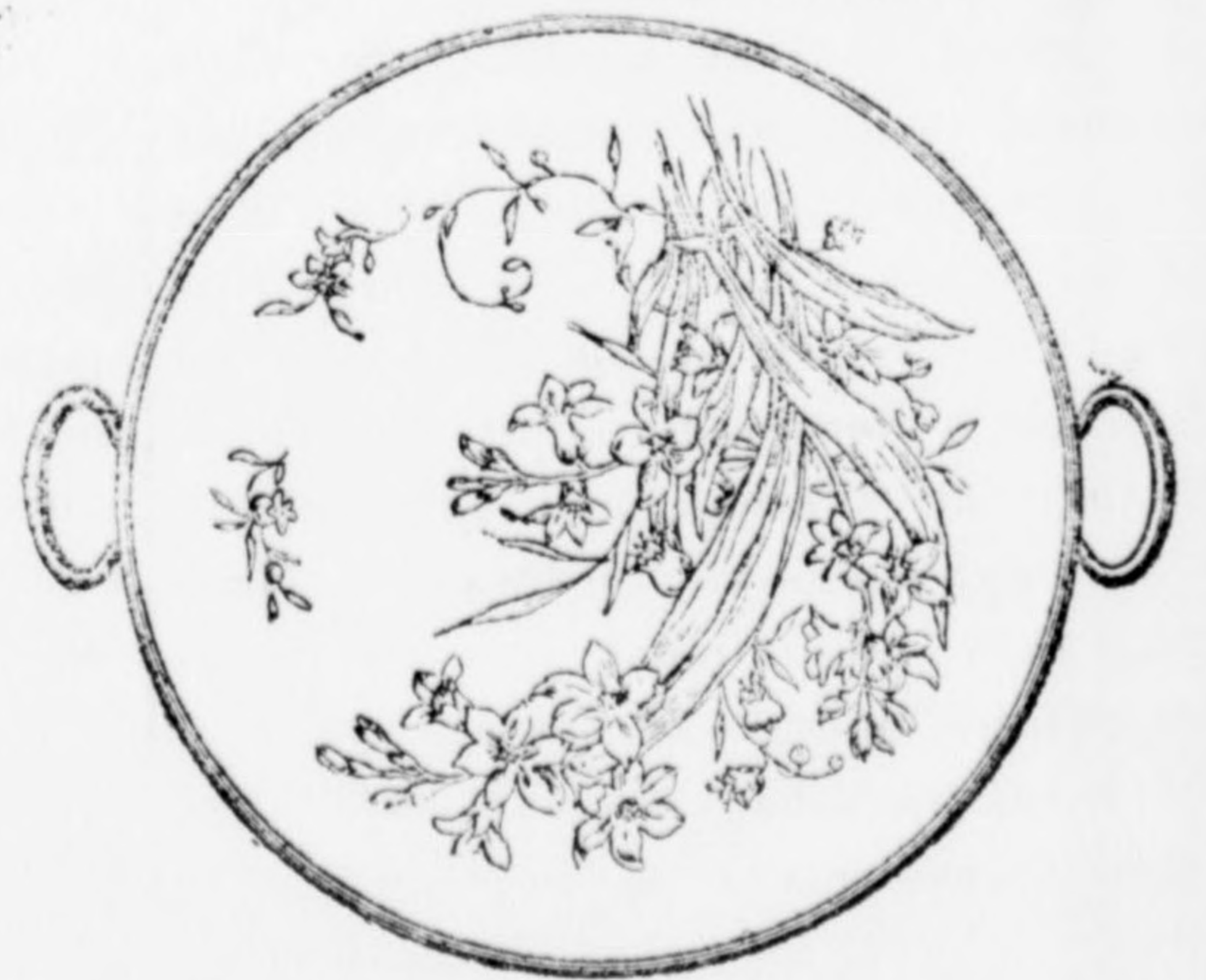
Tortatálczák a legszebben kiállitva, gazdag választékban 4 frttól 10 frtig.