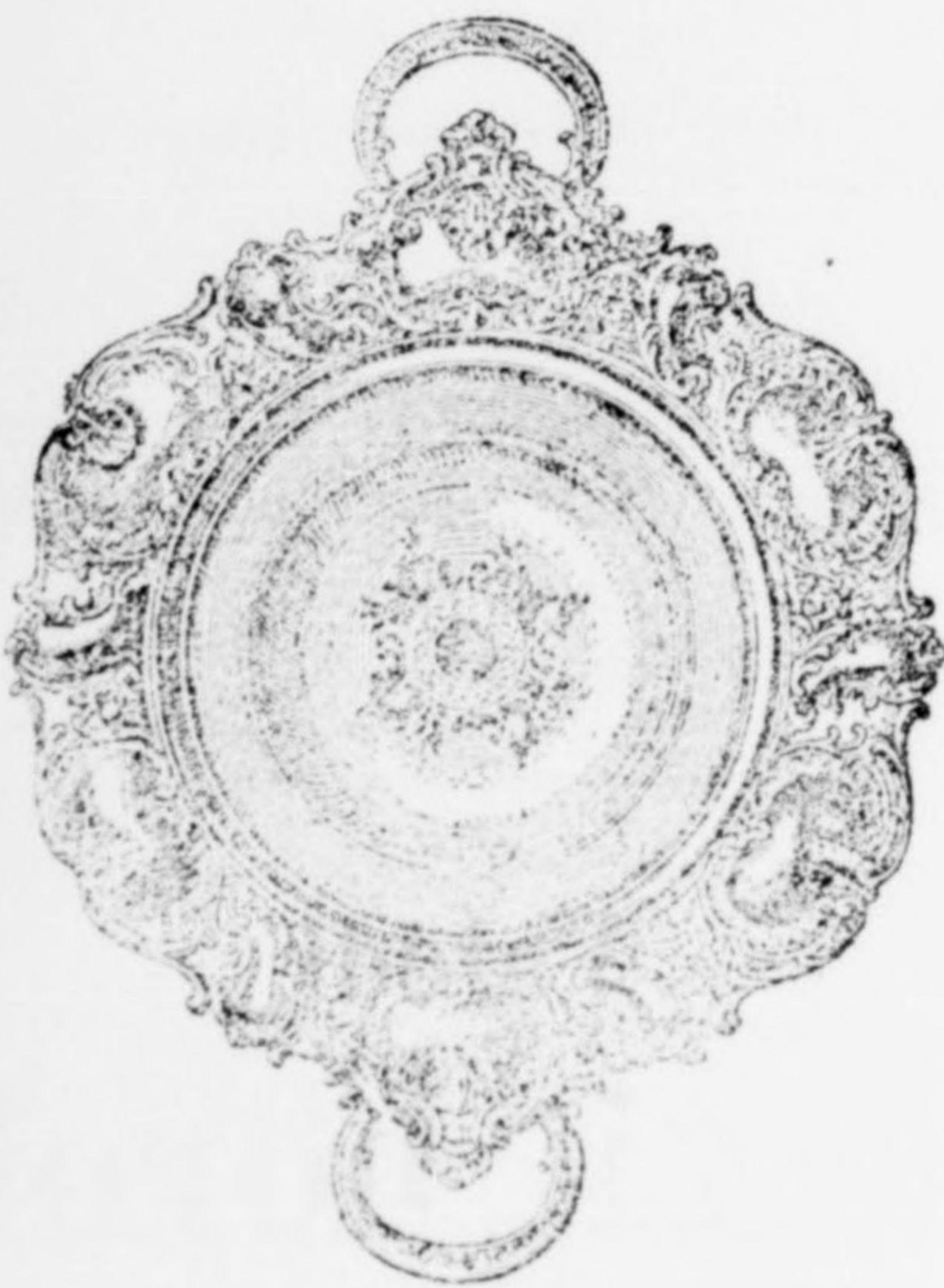
Kenyérkosár gazdagon vésve diszaranyozással 7 frt.

órás és aranyműves város épület, király fő-utca.