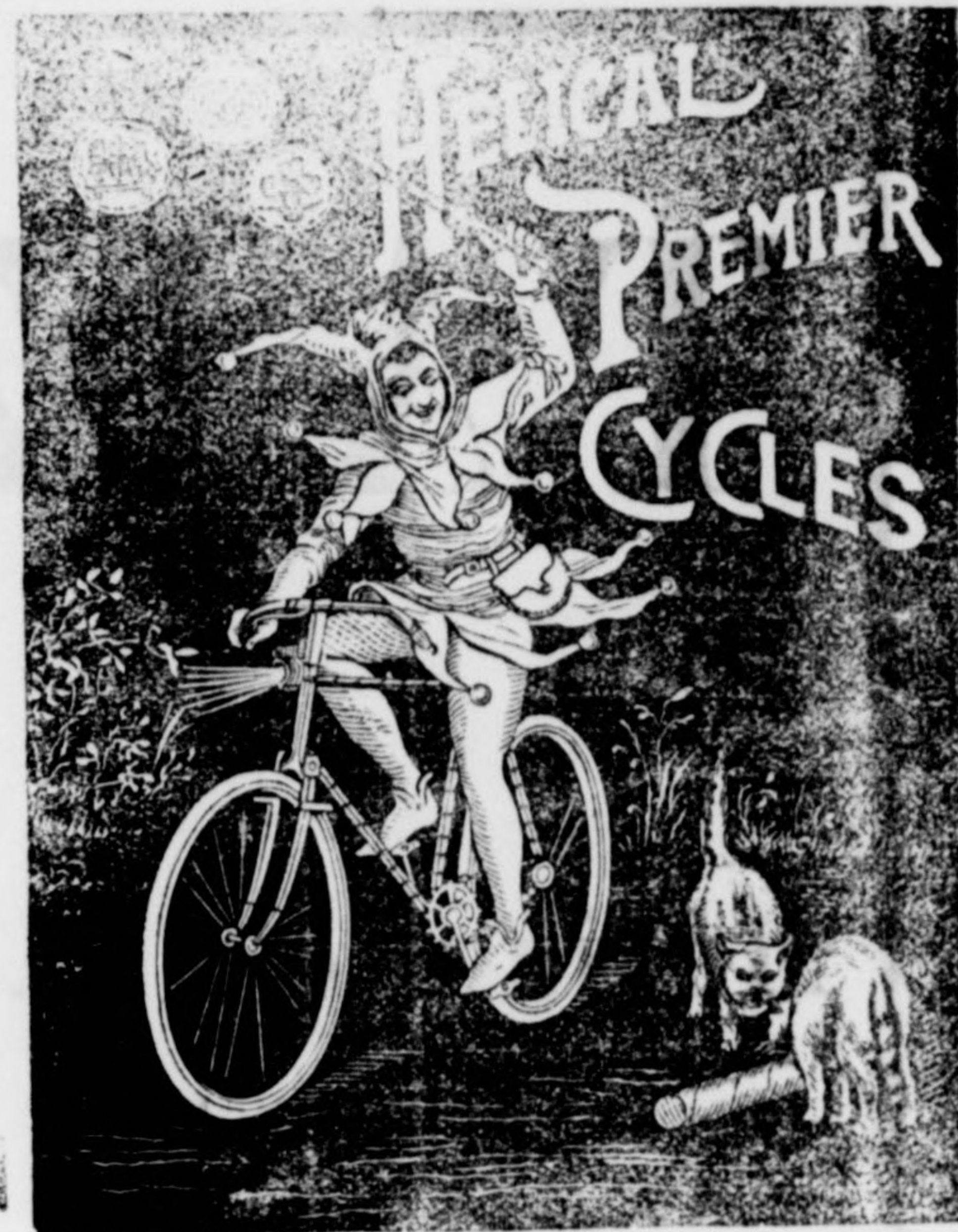
Pécsen egyedi raktár; Fürst Lipótnál. Széchenyi-tér 16 szám,