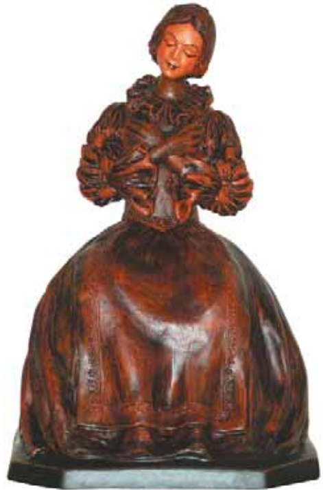
ÁRVA BETHLEN KATA