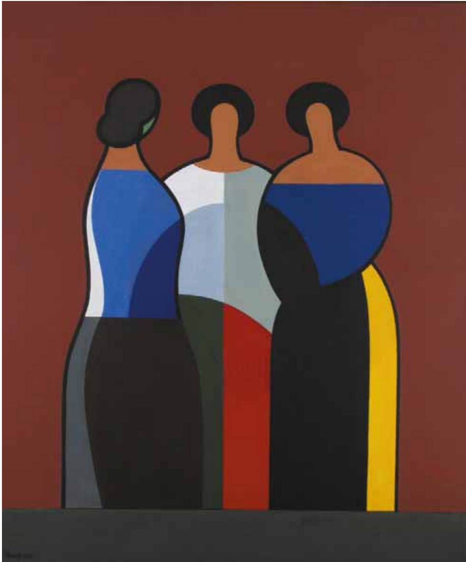
ASSZONYOK (HOMMAGE À BARCSAY)