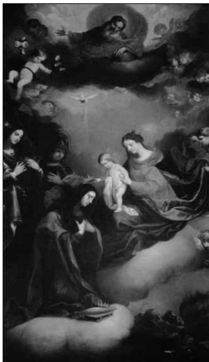
A templom főoltárképe

Európa évszázadok óta ezért őrzi tiszteletét alig néhány évvel halála után bekövetkezett (1235 évi perugiai) szentté avatása óta. Utazásaink során alakja ábrázolásainak végtelen sokaságából figyeljünk fel egy-egy – itt most nyilván csak szubjektív alapon kiszemelt – kevésbé ismert alkotásra, az ismertebb életút-helyszíneken (Sárospatak, Wartburg, Marburg) túl.