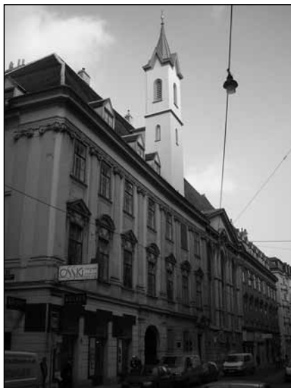
A német lovagrend temploma

formán csak a vallás és a dinasztikus szálak domináltak (mondanunk sem kell, hogy egy német hercegi szülőtnél is az utóbbit helyezték volna előtérbe), de életének húsz évét, s áldásos tevékenységét tagadhatatlanul e tartományban