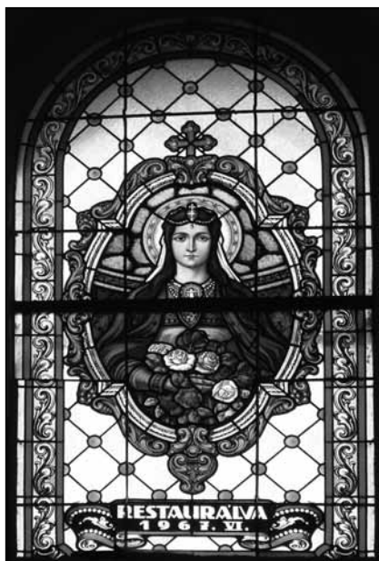
A tállyai római katolikus templom Árpád-házi Szent Erzsébet-üvegablaka az 1930-as években készült, és 1967-ben restaurálták

Se szeri, se száma a Boldogasszonyt, Szűz Máriát nevesítő szokásoknak, tárgyakkal, hiedelmeknek, sőt szer(ve)zetnek (l. Boldogasszony leányai , premontrai kanonisszák, Mária-kongregáció ). Nem csoda, hisz’ Mária nem is olyan régen még a legnépszerűbb női keresztnév volt. A két háború között a magyar lányoknak közel egyötödét e névre keresztelték (800 000), és a gyakoriságban második Erzsébet e szám felét sem érte el (300 000).