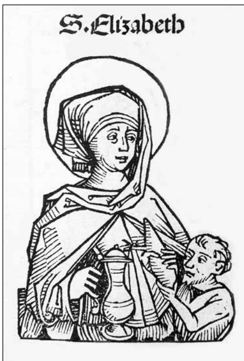
Árpád-házi Szent Erzsébet a Schedel-krónika ábrázolásán