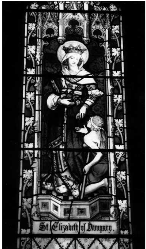
Üvegablak Erzsébettel Bishamban