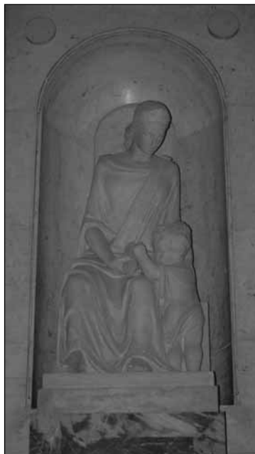
Ülő Erzsébet-alak a gyermekkel

Térjünk kissé északabbra és nyugatabbra. Nürnbergben a nevezetes Lorenzkirche dús faragású bejáratának boltíve felett találkozunk Erzsébet szoboralakjával, és a városban felkereshetünk egy külön Szent Erzsébet tiszteletére szentelt templomot is. Itt a szinte minden esetben álló alak helyett a szent éppen ülő helyzetben látható. Cipót nyújt oda egy kisgyermeknek, miközben az a térdére támaszkodik.