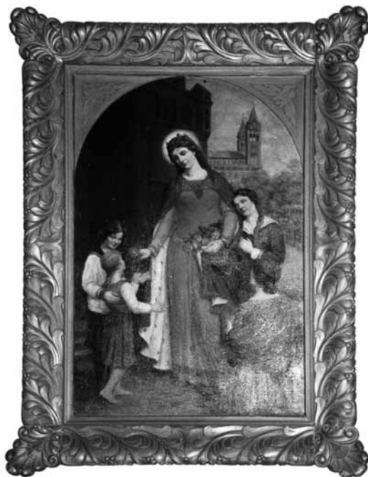
Valószínűleg osztrák mester készítette a Szent Erzsébetről készült festményt a pécsi Miasszonyunk templomában

Erzsébetnek 24 év adatott, hiszen 1231-ben hunyt el. Vélhetőleg Imrének is ugyanennyi, mert halála évszáma (1031) biztos, születési éve (1007) valószínűsíthető. Mi köti össze őket az azonos számú megélt éven túl? Az Árpádok vére és a közös keresztény hit. S ezen túlmenően a nemzet emlékezése.