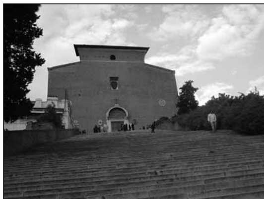
Róma: A Santa Maria in Ara Coeli-templom

Assisiben a Szent Ferenc-bazilika alsótemplomának Szent Erzsébet-kápolnájában az oltárkép Simone Martini alkotása az 1310-es évekből. Az oltárkép-freskó középső alakja Árpád-házi Szent Erzsébet, gazdagon díszített brokátruhában és palástban, királyi koronával a fején. Jobb kezében a nyakáról függő ékszert tartja, bal kezével unokahúgára, Szent Margitra mutat. Szent Erzsébet alakjában a képet megrendelő Mária nápolyi királyné (1285–1323) rejtett portróját láthatjuk, aki nagy tisztelője volt az Árpád-házi szentnek.