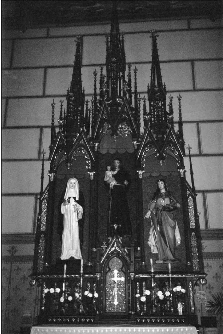
A bátaszéki Nagyboldogasszony-templom Pádulai Szent Antal-oltára, két oldalt Szent Margit és Szent Erzsébet életnagyságú szobraival