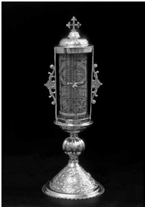
Árpád-házi Szent Erzsébet Sárospatakon őrzött ereklyéje

Szent Erzsébet a feleségek, a fiatal anyák, a ferences harmadrend és a szeretetszolgálat, a Karitász védőszentje. Nemcsak hívők számára példa alakja, hanem minden humánusan gondolkodó ember számára is.