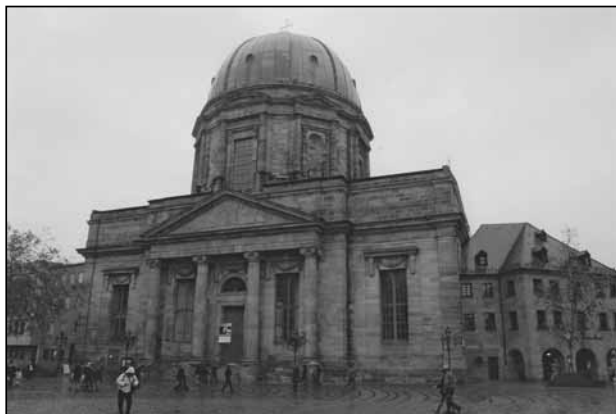
Nürnberg: a Szent Erzsébetről elnevezett templom