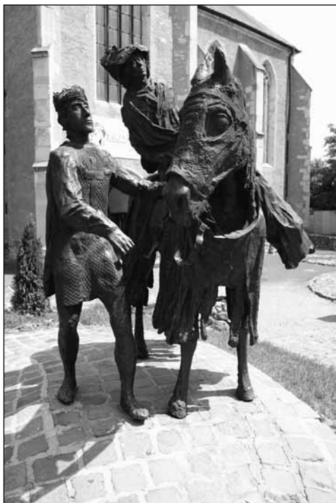
Árpád-házi Szent Erzsébet és Tübingiai Lajos szobra

Erzsébetet, már gyermekként súlyos csapások érték. 1213-ban anyja haláláról kapott hírt, 1216-ban jegyese, 1217-ben a jótevőjeként számon tartott Hermann őrgróf halt meg. Erzsébet jövője bizonytalanná vált. Egyetlen vigasza maradt, az őrgrófság örököse, Hermann testvére, Lajos. A hét évvel idősebb Lajossal 1221-ben keltek egybe. A házasság megszilárdította Erzsébet helyzetét az udvarban. Lehetőséget és hatalmat kapott, hogy olyan hercegnőként uralkodjon, aki megfelel a világi körülményeknek és az egyházi ideáknak. Erzsébet előkelő származása ellenére nem vált a pompa és a gazdagság rabjává. Ellenkezőleg, a keresztény uralkodónő egyházi ideálja fogalmazódott meg Erzsébet vallásosságában. Szerzetesi erények ékesítették: a türelem, a szerénység, az alázatosság. 42 Például első gyermeke, Hermann születése után (1222) halál-