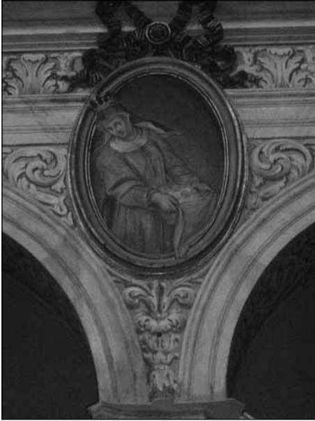
Árpád-házi Szent Erzsébet-ábrázolás az Ara Coeli-templomban

ta Maria in Ara Coeli-templomban majdnem mindegyik magyar turista megfordul. A templom főhajójában, az oszlopok fölött ovális képekben szentek, közöttük Árpád-házi Szent Erzsébet ábrázolása látható, Fra Umile di Foligno alkotása 1709-ből.