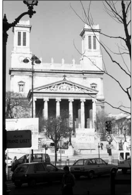
A Saint-Vincent de Paul-templom

Szintén a Szajna északi oldalán, a tizedik kerületben található a Saint-Vincent de Paul-templom, amely éppen a Place Franz Liszten, a mi Liszt Ferencünkről elnevezett téren emelkedik. (Liszt a közeli Érard-házban lakott, ott is és a téren is van emléktáblája.) A kéttornyú impozáns épület jobb oldalhajójában a harmadik kápolna neve: