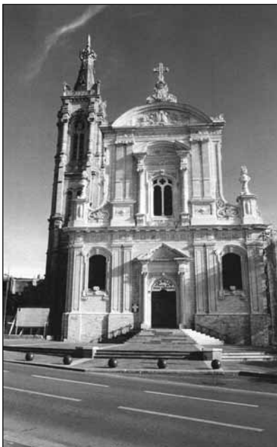
A cambrai katedrális