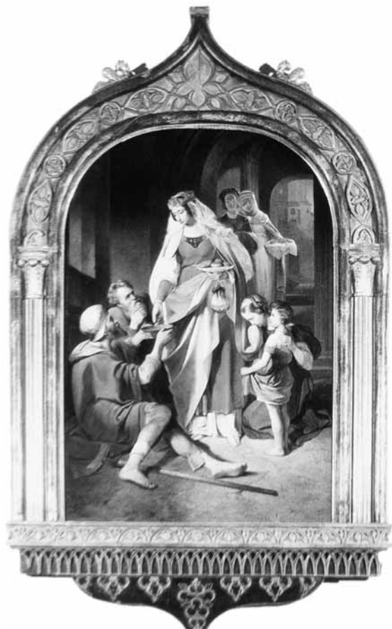
Szent Erzsébet alamizsnát oszt. Franz Eybl (1806–1880) festménye a sárospataki Vörös Torony kápolnájában

A lovag sarkon fordult, és most már tudta, mit kell tennie.