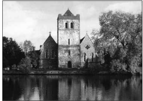
A Temze melletti Bisham temploma

Ezzel a gondolattal zárjuk csak néhány országot érintő, Szent Erzsébet- emlékeket felvillantó európai utunkat a világnak a legtöbb szentet és boldogot adó Árpád-dinasztia egyik legszebb virágának nyomdokain.