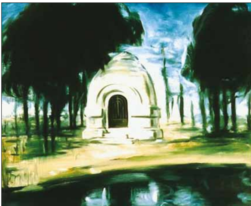
A TEMETŐ I.