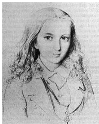
Felix Mendelssohn-Bartholdy gyermekként