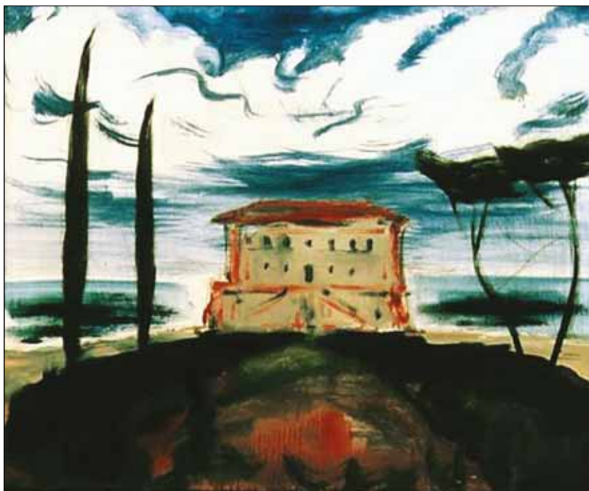
MEDITERRÁN TÁJ II.