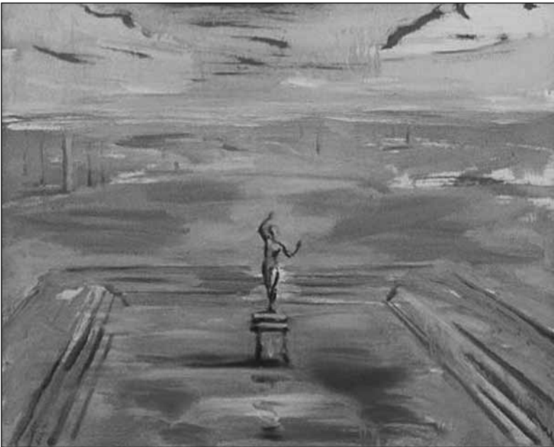
A FAUN HÁZA I.

lábbal hajtja a háromkerekűt, fut vele muskátlibokrok földszaggal telített illata kavicsbetonon zörög az összedrótzott kopott, tömött gumis kerék őrült körök árkok barázdálják az udvart a verandáról (és még ezerféleképpen birtokolható a veszíthető) kósza fűcsomók fordulnak a szaporázott léptek nyomán piros szandálban lábujjai közé, talpa alá eszi be magát a por rázná söpörné mossa az udvari csapnál szétspriccelő vízszugár körül döngő méhek a nádtetőből gyermekkora emlékeire ráborul a szomorúfűz