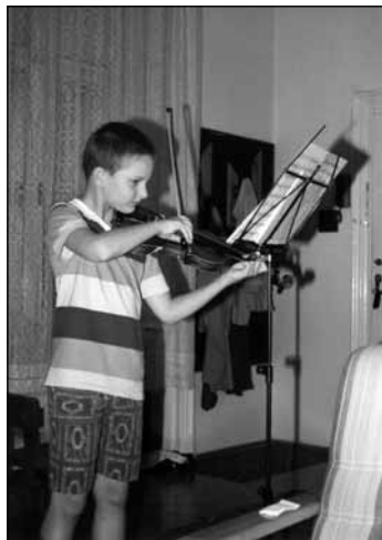
Hegedülő mai 10 éves

E.B.E.: Röviden: mindent szeretnek, ami szép, izgalmas, érdekes zeneileg, érzelmileg, vagy hangzásában újszerű, de emészthető számukra. Sok felnőtt van, aki nem képes olyan őszinte rácsodálkozással fogadni egy-egy ósrégi, mind szövegében, mind dallamában melankolikus-fájdalmas bujdosó vagy szerelmes dalt, mint ahogy ők, akik magyar népzenei, népköltészeti fordulatokon keresztül jutottak zenei ismeretekhez. Ugyanakkor felpeszsdítően hat rájuk az izgalmas ritmusú (pl. váltakozó ütemű, „lejtésű”) dal, amihez egyszerű tánclépéseket adhatunk. Szeretnek hozzá különböző ritmus-kíséreteket kitalálni, főleg ha azokat meg is hangszereljük, tehát kisebb ütőhangszereken játszhatják. Mindig emeli a hangulatot, ha valami 2-3 szólamban jól sikerül, különösen ha kombinálni tudjuk az éneket hangszerek hangjával. A lehetséges variációk száma mindig eléri azt a szintet, hogy ne kelljen félni az unalomtól. A variáló kedv 10 éveseknél már annyira fejlett, hogy mindig akadnak, akik gyűjtik (lejegyzik) saját kis kompozícióikat. (Vannak iskolák, ahol ezt magas szinten művelik.)