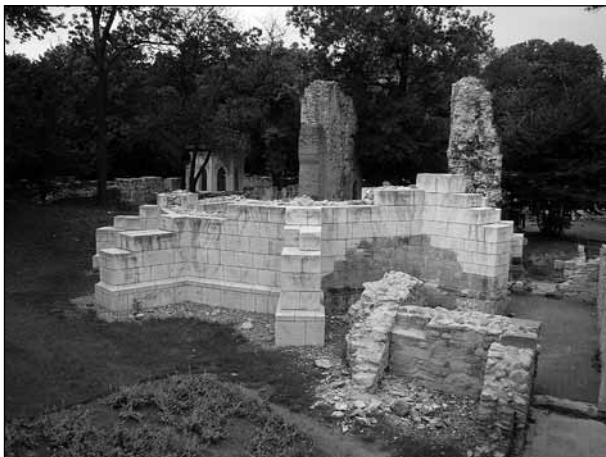
A mai romterület

A ferences templom maradványa a minoritáké volt. A szigeten a XIII. században megtelepedett ferencesek kolostorukat a század vége felé építették, a XIV. században átalakították, toronnyal bővítették. A török uralom alatt rom-