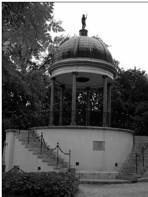
A zenélő kút