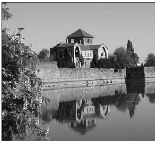
A tatai vár

hiszen csak ennek mentén haladva tud fejlődni. A Magyary-terv vitáitát hosszas előkészítő munka után a tataiak 2007 őszén ismerhették meg, melyet az önkormányzat közös vitára bocsátott a közösségek, intézmények, a lakosság részére. A több mint 400 hozzászólással, javaslattal kiegészített vitáit most könyv alakban foglalja össze