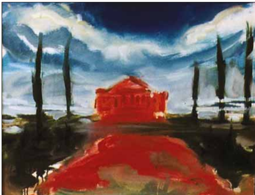
MEDITERRÁN TÁJ I.