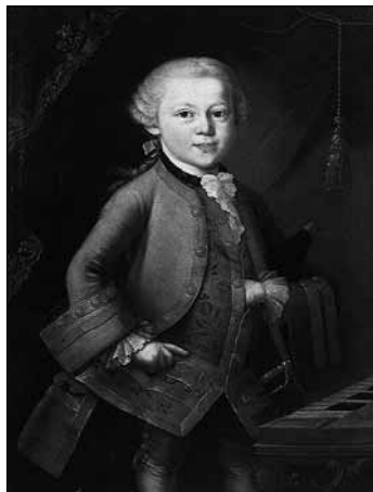
A gyermek Mozart

Az előbb felsorolt különleges képességű gyermekek valószínűleg már korábbi életkorban is kiemelkedő teljesítményekre voltak képesek.