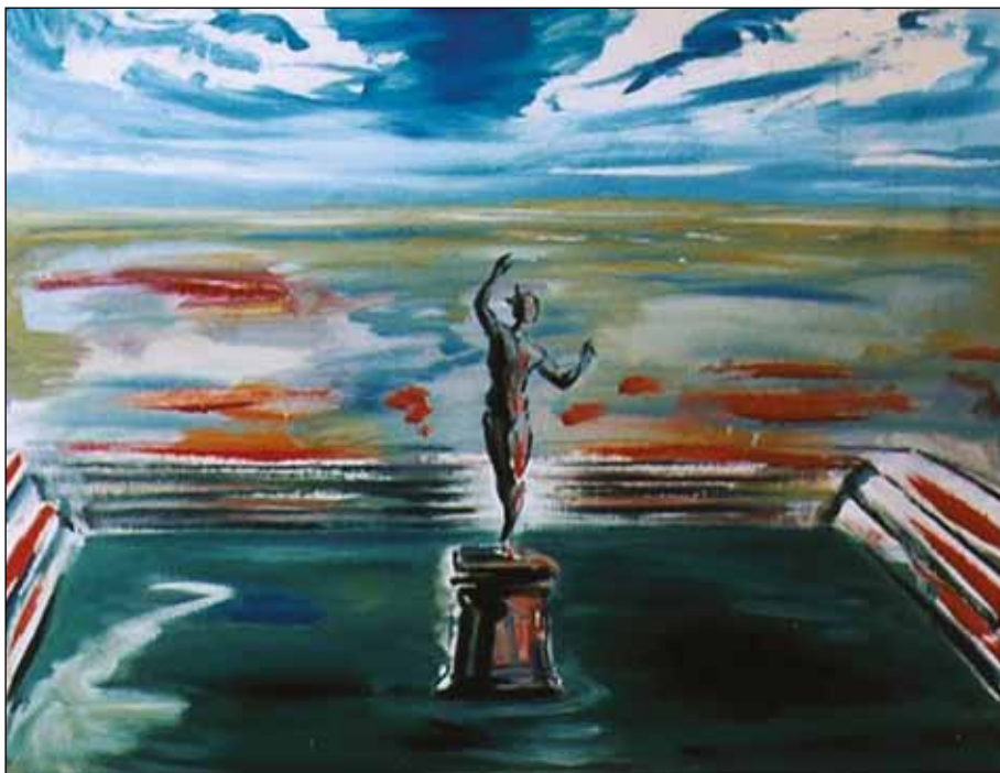
A FAUN HÁZA II.