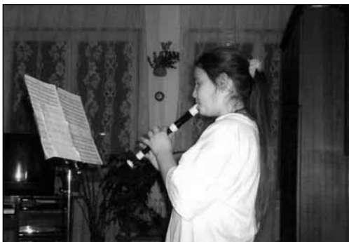
Furulyázó mai 10 éves

E.B.E.: Sok, sokkal több pedagógiai optimizmusra és önreflexióra inspiráló, egymást segítő szakmai kisközösségre lenne szükség! Valamint meg kell ragadni minden fórumot, hogy meggyőzzük mind a szülőket, mind a politikusokat – talán elsősorban ez lenne a lényeg! – hogy a zenélést, színvonalas zeneoktatást mint az érzelmi intelligencia gazdagításának, a munkához való viszony egészségesebbé tételének eszközt minden módon támogassák. Ebben – mint más művészeti ágakban is persze – munkaerővel, életkedvvel összefüggő hatásokat érhetnének el, költségei közgazdaságilag is „megtérülnének”, ha egy átfogó, átgondolt kormányprogram révén az egész ország népességét elérhetnének vele. Vannak bölcsebb európai országok, ahol ezt nemcsak felismerték, de már el is indítottak olyan zenei tömegmozgalmakat, amik egy intellektuálisan (és testileg is!) teherbíróbb, társadalmilag szolidárisabb, érzelmileg intelligensebb nemzedék felnövekedését ígérik. Csak akkor leszünk képesek hasonló eredményeket felmutatni – sajátos zenei hagyományaink megtartásával –, ha a lehetséges segítőkkel – szülőkkel, társszakmákkal (pszichológia, óvodapedagógia, tanárképzés) – összefogunk, s követeljük, hogy a legfelsőbb szinten valódi szakértők segítsenek minket jó céljaink felé.