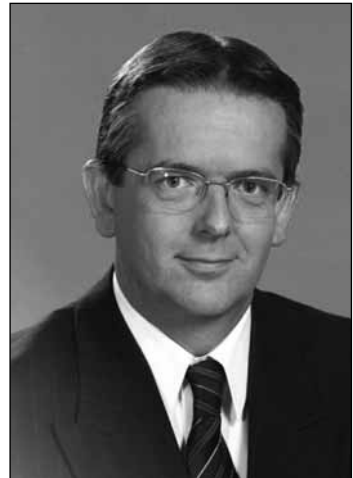
Michl József – Tata város polgármestere

Büszkék vagyunk arra, hogy a városvezetés és Tata polgárai közösen összefogva együtt tervezik a jövőt, együtt fejlesztik, építik tovább saját városukat. Ma is jó tatainak lenni, de úgy reméljük, hogy a jövőben még jobb lesz.