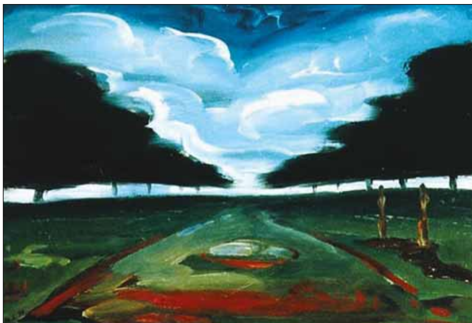
A PARK X.