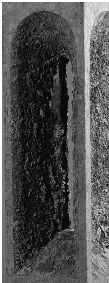
KONTUR ANDRÁS BOLTÍVES ABLAK (RÉSZLET)