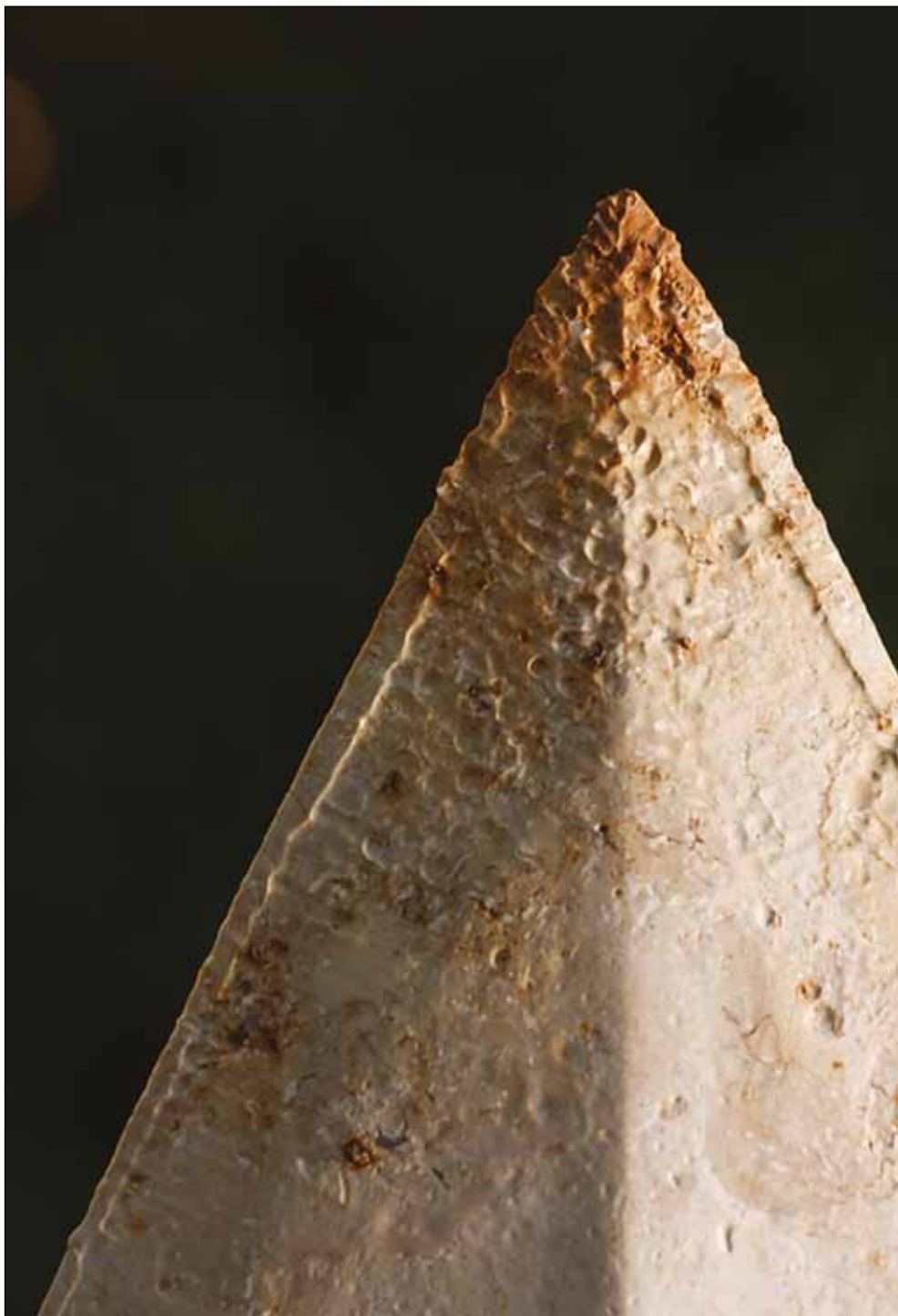
LÁNDZSAHEGY 3. (RÉSZLET)