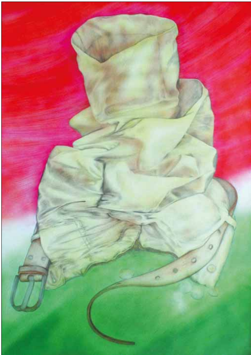
A SZABADSÁG REDUKCIÓI II.