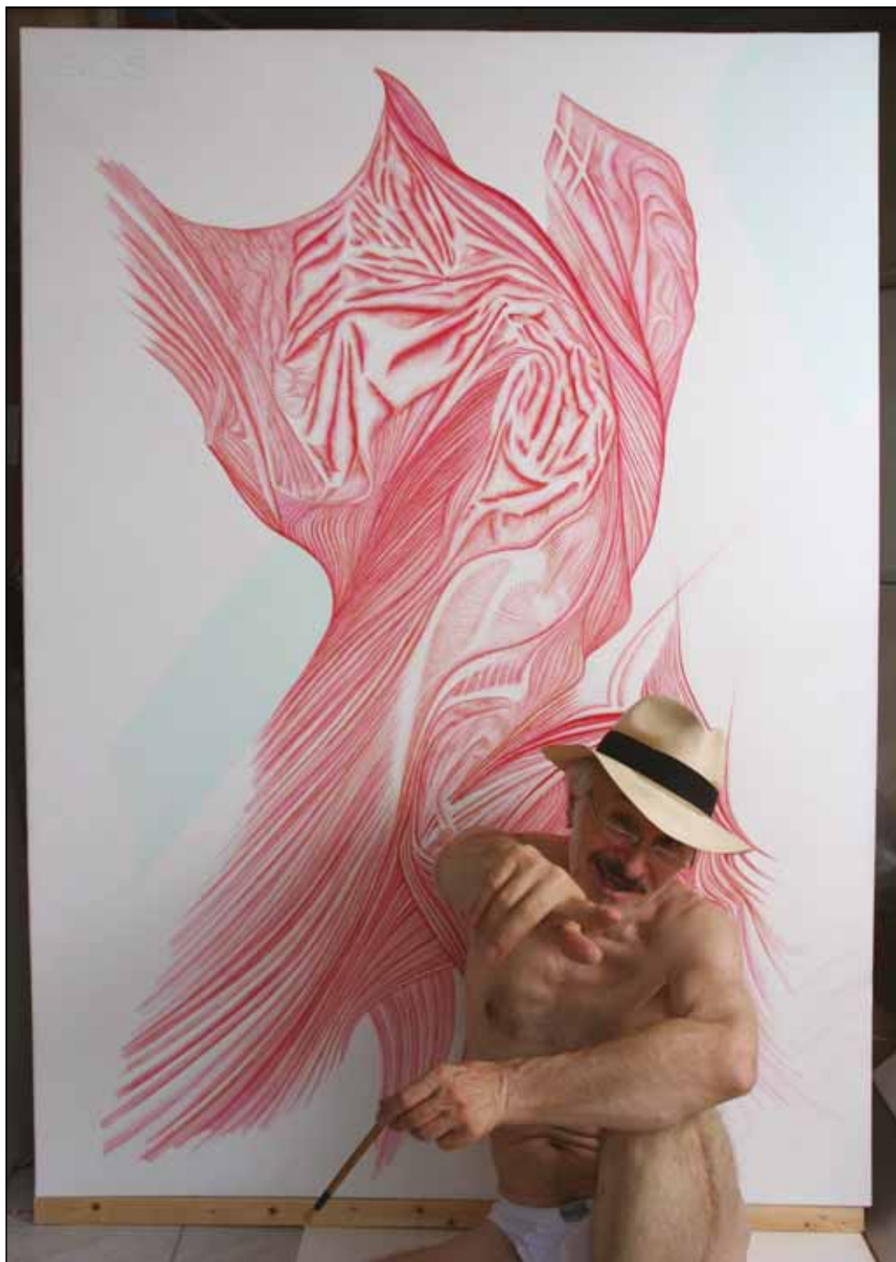
KÉSZÜL A „JÓSKA BÁCSI KEDVESE TARKÓTÓL”, AVAGY A „NAGY VERES FENEVAD”