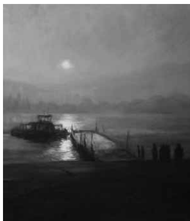
NYAKAS ATTILA RÉVÁTKELÉS (RÉSZLET)