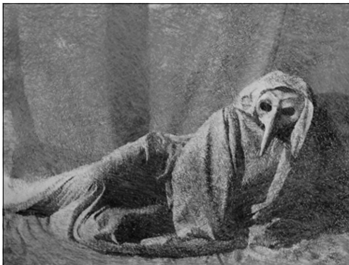
MOLNÁR KÁLMÁN | NYELVEMLÉKEK SOROZAT (POR ÉS HAMU I.)