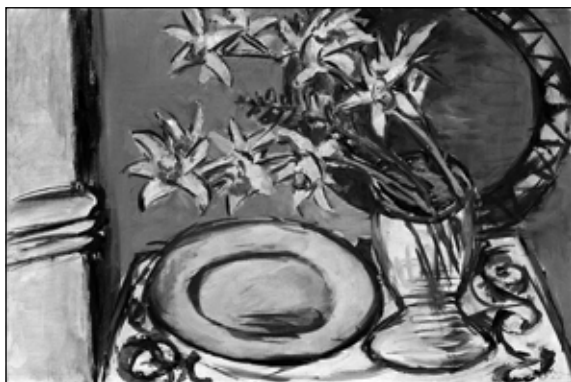
Max Beckmann: Orchidea-csendélet zöld tányérral , 1943 (olaj, vászon, 60×90 cm)

Beckmann – s talán a teljes expresszionista részleg – fő műve a kiállításon az Orchidea-csendélet zöld tányérral című olajkép, mely plasztikusan érzékeltet két, a stílus recepciójához átfogó értelemben is fontos tényezőt. Az egyik az expresszionista művészek azon törekvése, melytől vezérelve fő referenciájuként tekintenek saját érzékenységükre és észlelésükre, s ebből kiindulva, valamint az empátia képességén keresztül