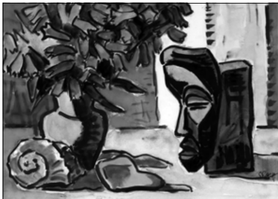
Karl Schmitt-Rottluff: Csendélet harangvirággal, maszk előtt , 1943 (akvarell, 48×68 cm)

pedig tovább folytatja, így mozgását a szürke fal hármias osztatú törésvonalra vezeti ki a képből. A másik kulcsfontosságú tényező pedig az az – a Der Sturm egykori igazgatója, Herwarth Walden által kifejtett – álláspont, miszerint az expresszionizmus formakultúráját és technikáját az különbözteti meg a vele párhuzamosan induló francia vadak festészetétől, 5 hogy befogadta különböző modern stílusok-művészek, köztük épp Matisse vagy Rouault fauveista impulzusait. Ezek jelentős nyomokat hagytak az elemzésünk tárgyát képező Beckmann-csendéleten is, főként az erőteljes színhasználat, a formák megkomponálása, a térbeliség és a perspektíva elhagyása esetében. Ebből a szempontból pedig meg kell említenünk Karl Schmitt-Rottluff Csendélet harangvirággal, maszk előtt című képét is, mely hasonló jelleget öltve mintha a magyar Nyolcak csoport némely művészeinek – szintén a matisse-i fauveizmusból táplálkozó – stílusát idézné meg. Különösen szemléletes a profilban megjelenített maszk kissé kubista megfogalmazásmódja, Tihanyi Lajos festészetére, Kassák Lajos és Fülel Lajos portréira emlékeztetve a nézőt.