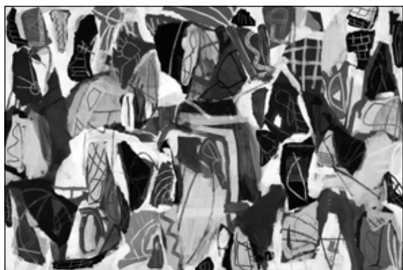
Jan Voss: Részletek , 1996 (vegyes technika, vászon, 130×195 cm)

A pop-art seregszemléjét követően a kiállítás záró szakaszába lép a 20. század végi, 21. század eleji művek felvonultatásával. Az utolsó termék