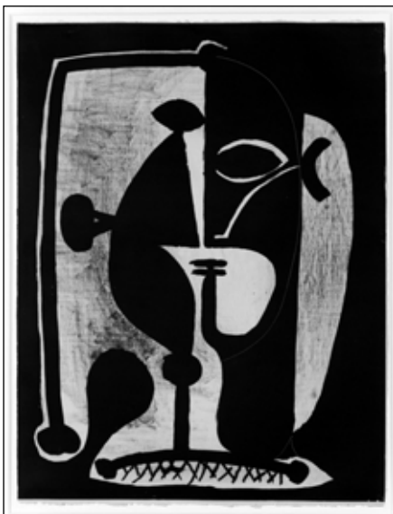
Pablo Picasso: Figura 21.11. , 1948 (litográfia, 64,5×49,9 cm)

még fenntartja, melyet majd az absztrakt fog végérvényesen eltörölni. 9