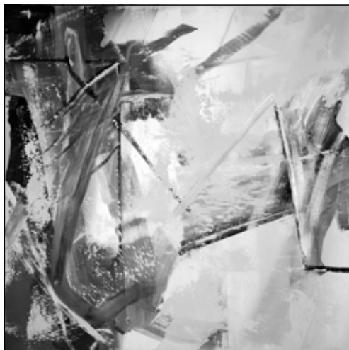
Gerhard Richter: Absztrakt festmény 555 , 1984 (olaj, vászon, 250×250 cm)

A német színésznőről készült szitanyomat a művész hollywoodi hírességeket megörökítő sorozatának árjába illeszthető, tolmácsolva a warholi „piacutató művészet” lényegét. Emellett mindkét kép azon filozófiai vonulatra épül fel, melyet Warhol dolgozott ki, s melynek lényege a műalkotás státusának – a művész részéről történő – szándékos megkérdőjelezése. Az e szellemiség szer-