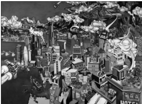
Martin Schuster: Es ist soweit , 2009 (olaj, akril, vászon, 180×252 cm)

Így ér körbe e művészettörténeti narratíva az 1900-as évek legelejének német festőitől egészen napjaink alkotóinak reprezentálásáig. A szóban forgó időintervallumot, e több mint száz évet az adott keretek által biztosított, lehető legnagyobb részletességgel fogadhatjuk be. Az épületből kilépve, a bejárattól jobbra tekintve pedig újra