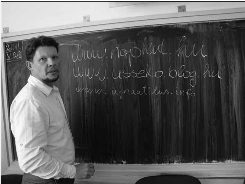
A költői kastély iskolatermében, 2011