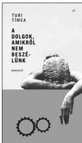
Turi Tímea, A dolgok, amikről nem beszélünk , Magvető, Budapest, 2014

Turi Tímea ebben a kötetében – éppúgy, mint az előző, Jönnek az összes férfiak címűben – csak nagyon pontos meglátásokat és csak nagyon pontosan tárgyalt. A cím a borítón a következőképpen jelenik meg: