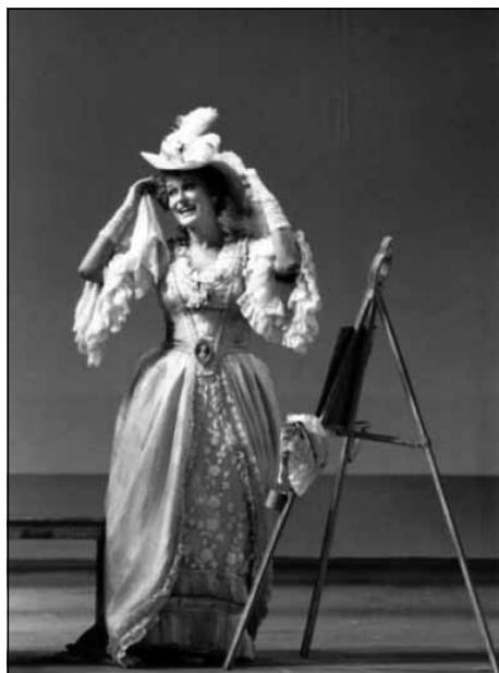
W. A. Mozart, Così fan tutte (Fiordiligi szerepében, San Francisco, 1988)

Rekonstrukciós munkák miatt az Operaház ideiglenesen bezárt, csak az Erkel Színház működött. Mihály András ennyit fűzött még mondandójához: „Ha a szopránok megtudják, hogy én egy keramikust vettem fel, amikor nekik is kevesebb a fellépésük, holnap rám török az ajtó.” Mihály András igazgató úr 1982 augusztusában szerződöttem, így indult operai pályafutásom és lettem a dalszínház magánénekesese. Egymás után jöttek a feladatok. Első színpadra lépésem Wagner Parsifaljának egyik viráglánya volt, Ferencsik János fő-zene-