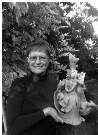
W. A. Mozart, Varázsfuvola , az Éj királynője

énekművész, szoprán, keramikus (Budapest, 1947. május 29.)