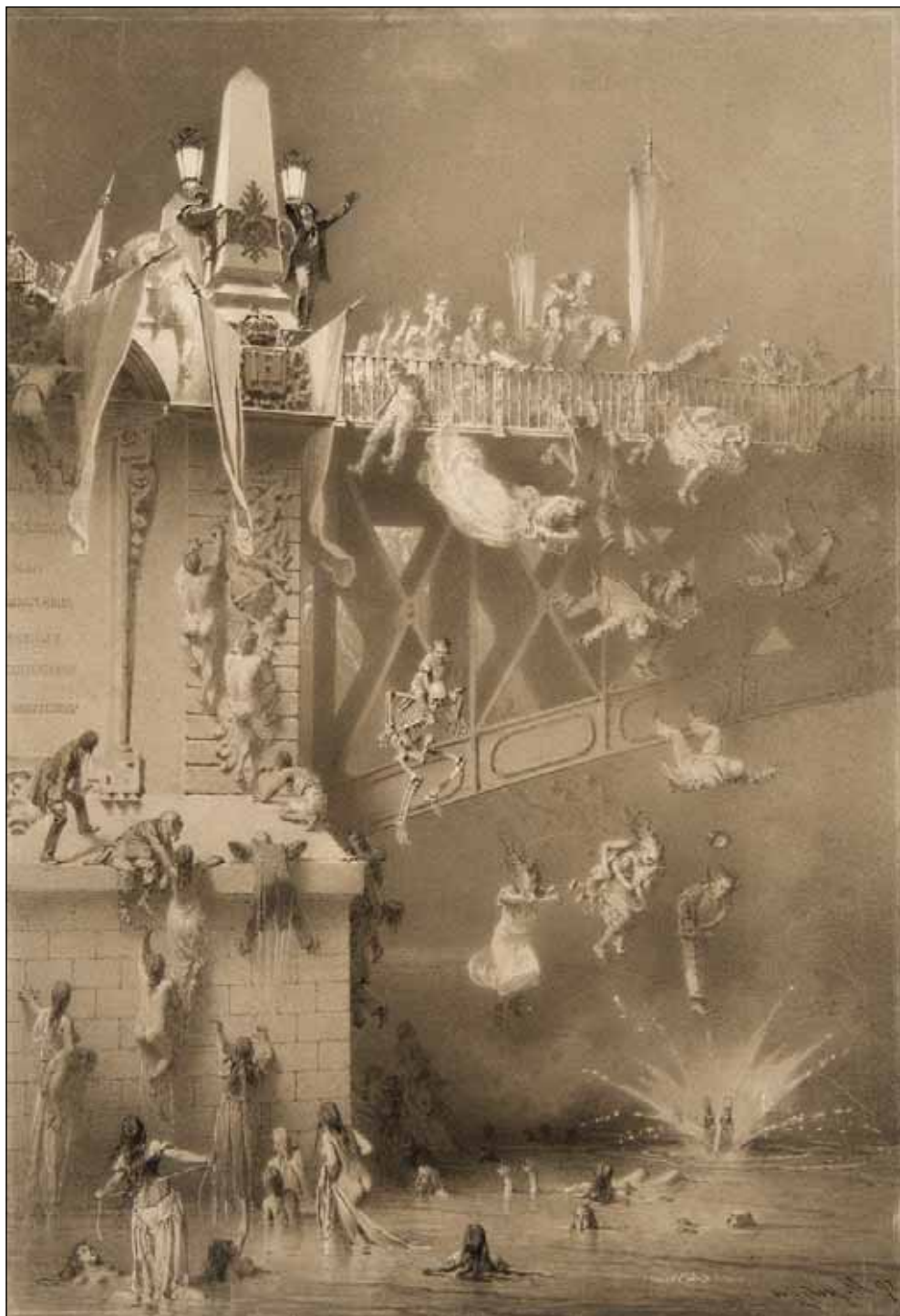
ZICHY MIHÁLY: HÍD-AVATÁS