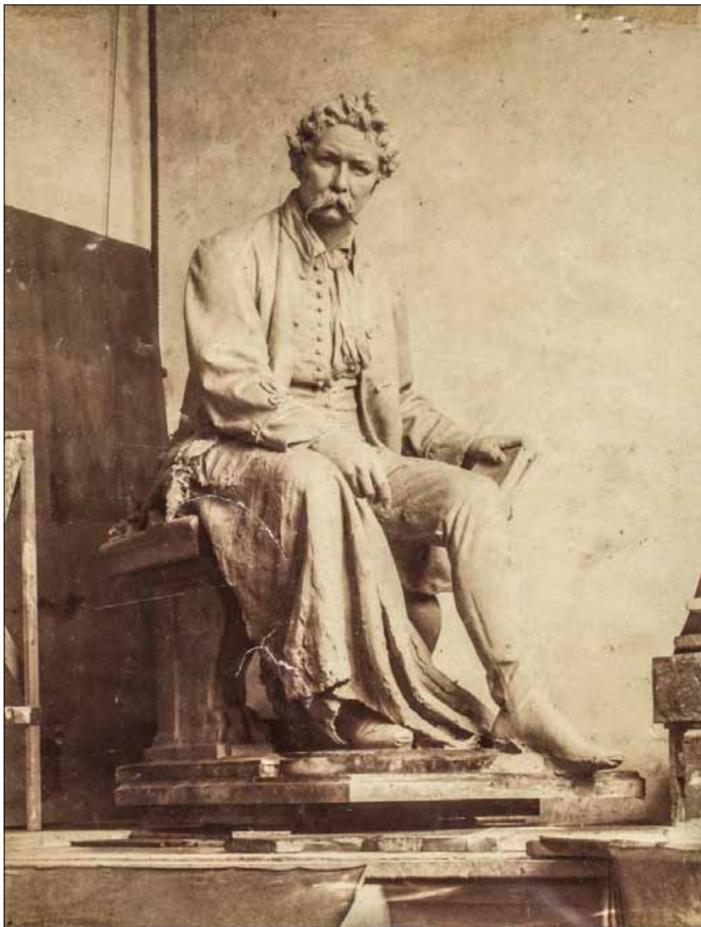
STRÓBL ALAJOS ARANY-EMLEKMŰVÉRŐL KÉSZÍTETT EGYKORÚ FOTÓ