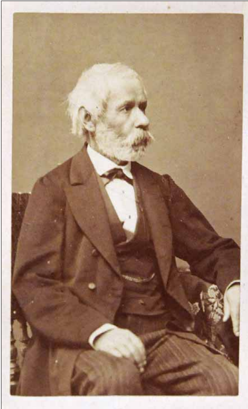
ARANY JÁNOS FÉNYKÉPE A FŐTITKÁRI ÉVEKBŐL