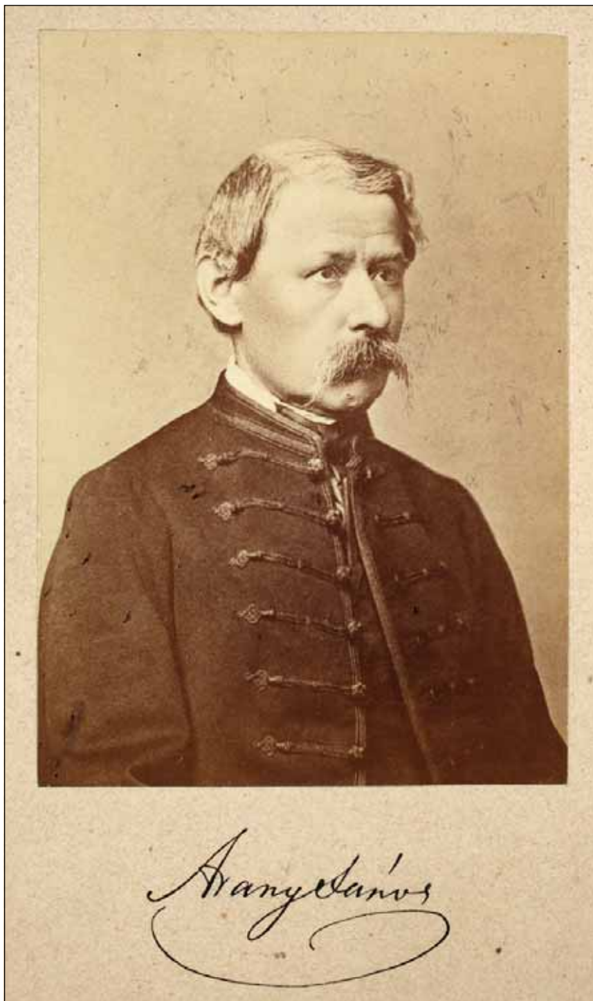
ARANY JÁNOS ARCKÉPE