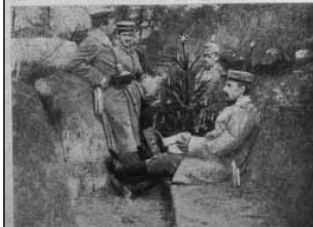
Karácsony a frontvonalban. A szeretet szép és szent társaságában a harc világlá

szőlőből vágják és a karácsonyfákat, amelyeket hazáról kaptak. A karácsonyfák olyan aprók, mintha csak játékszerük volnának. De a fát az apró gulyákat valahogy mégis magyobb szeretettel ékeztik, dílik, mint a francia földből kindt fenyőfákat. Dörögnek az ágyúk, m