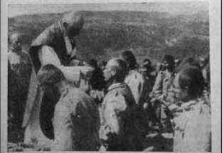
...személyesen jertek a harcok, kint sőt ott, a szent ányk alatt...

A Kárpátokban hivatal nélkül fenyőfák, mintha kinnlálak a fenyőfák. Ezer és ezer életem karácsonya kint. Bem az erdőben, az ányk vonak magától kintől ottlálak fát és fenyőre, csak a szent este jertek a harcok, kint sőt ott, a szent ányk alatt. Kint, az elő vonalban azonban sőt sem mondhatott helyeről, sőt a k