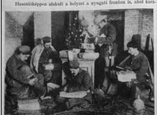
A harcok előlított karácsonyi események

Az orosz és szerb frontokon nem mindenütt uralkodott azonban halgtalagos fegyverszünet a szembenálló felek között. Sőt frontvonalban éppen a szent este tündöklött a legélédzebben a harc, a viaskodás. Hasonlóképpen alakult a helyzet a nyugati fronton is, ahol kara