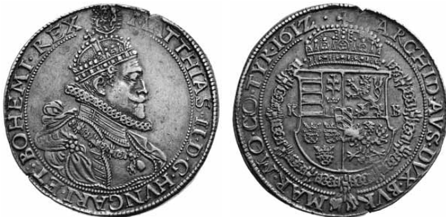
A Szent Korona hiteles ábrázolása II. Mátyás király (1608–1619) 1612-ben vert tallérján