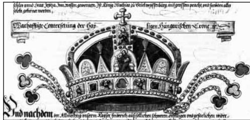
A Szent Korona első hiteles ábrázolása az 1560-as években készült Habsburg-krónikában (Clemens Jäger, Ehrenspegel des Hauses Österreich )