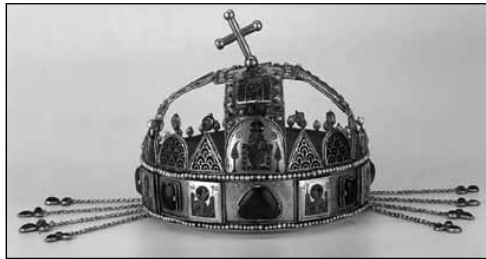
A Szent Korona mai állapotában