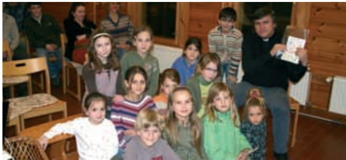
Bárdudvarnoki és kaposszentbenedeki gyerekekkel