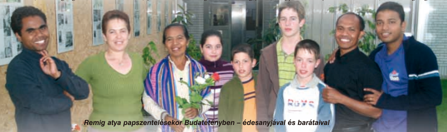
Remig atya papszentelésekor Budatétényben – édesanyjával és barátaival

Országszerte sok templomot lerombolt a hurrikán. A kormány nagyon nehezen ad csak engedélyt az újjáépítésre. Az emberek azonban türelmesen várnak, és keresik a lehetőséget a pappal és az egymással való találkozássra, a közös imára, szentmisére. Gyakran mindezt saját otthonaikban valósítják meg. Persze ehhez is a kormánytól kapunk engedélyt, ami azt mutatja, hogy a kormánynak is van szíve. Am az még jobb, hogy vannak jószívű emberek, akik megenge-