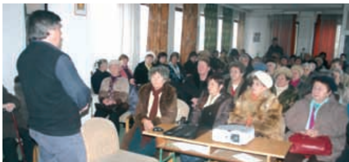
A három missziós imaközösség találkozása Nagykanizsán