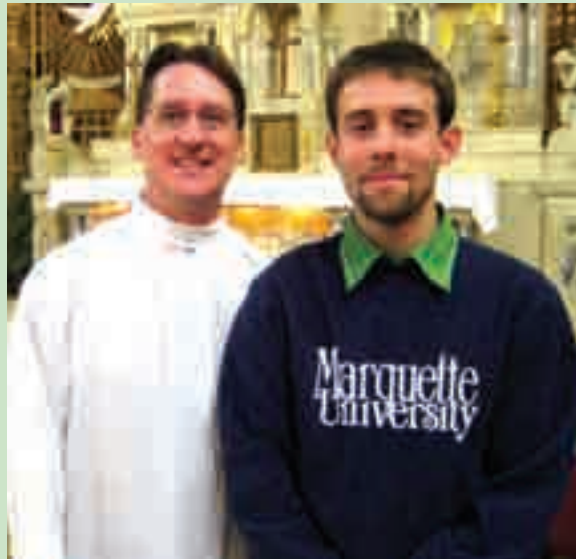
Ádám atya és a szerző

– Az, hogy az emberek hallottak arról, hogy van vallás, nem jelenti szükségszerűen, hogy a vallásukat aktívan gyakorolják vagy bármifajta lelki éltet élnének. Sok országban, amelyet vallásosnak tartanak, mint például a Fülöp-szigeteken, ahol magam is misszionárius voltam, az ország nyolcvan százaléka katolikus, az emberek gyakorolják a vallásukat, de a hitről való tudásuk és a hitről való gondolkodásuk elég csekély. A Fülöp-szigeteken mindenki meg van keresztelve, mindenkit megbérmáltak, de ez sokkal in-