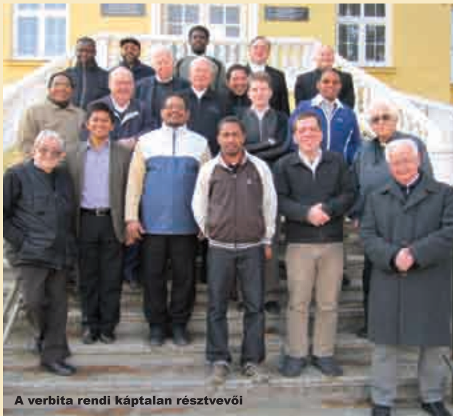
A verbita rendi káptalan résztvevői