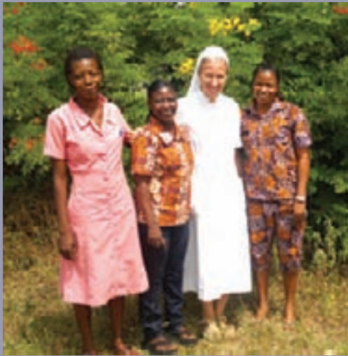
Öröm köztük lenni

Kelet-Ghána lakosságának csak 15 százaléka tud írni és olvasni. Amikor egy nő szülni jön, akkor az ujját használja pecsétként, hogy aláírja a dokumentumokat. A szórólapjaink, a rendelőben kifüggesztett plakátjaink semmit sem jelentenek nekik. Az időt sem úgy érzékelik, mint mi, így nem lehet velük megbeszélni, pontosan mikor kellene vizsgálatra vagy oltásra jelentkezniük. Ez nekik így természetes. A másik probléma a nyelv. Bár Ghána hivatalos nyelve az angol, a nők 85 százaléka soha nem járt iskolába, és csak helyi nyelven beszél. Csodálom az itteni asszonyok erőnlétét. Sokat dolgoznak a me-