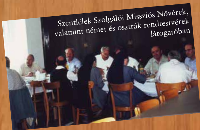
Szentlélek Szolgálói Missziós Nővérek, valamint német és osztrák rendtestvérek látogatóban