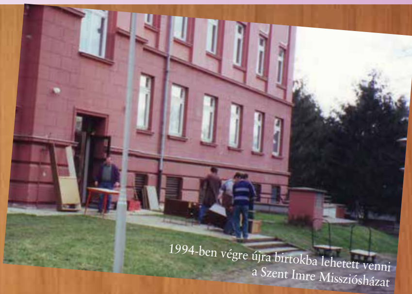
1994-ben végre újra birtokba lehetett venni a Szent Imre Misszióházat