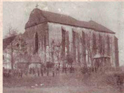
A nyírbátori minorita templom

Hajnalban, ahogy tébláboltunk, megjelent egy középkorú férfi, bemutatkozott, hogy ő a helybeli református esperes, hallották, hogy ide is hoztak szerzeteseket, kérdezte, hogy van-e ennivalónk vagy egyáltalán mire van szükségünk? Mondtuk, hogy nincs semmink. Máris ment és nem sokára friss, ropogós zsemlelkel, kenyerekkel jelent meg és hozzá tejet, vaját, kolbászt, szalonnát, paprikát, paradicsomot és sok minden mást is hoztak. Bizony, legelőször a református testvéreink láttak el bennünket étellemmel! A jó Isten áldja meg őket és utódaikat is. Ezt