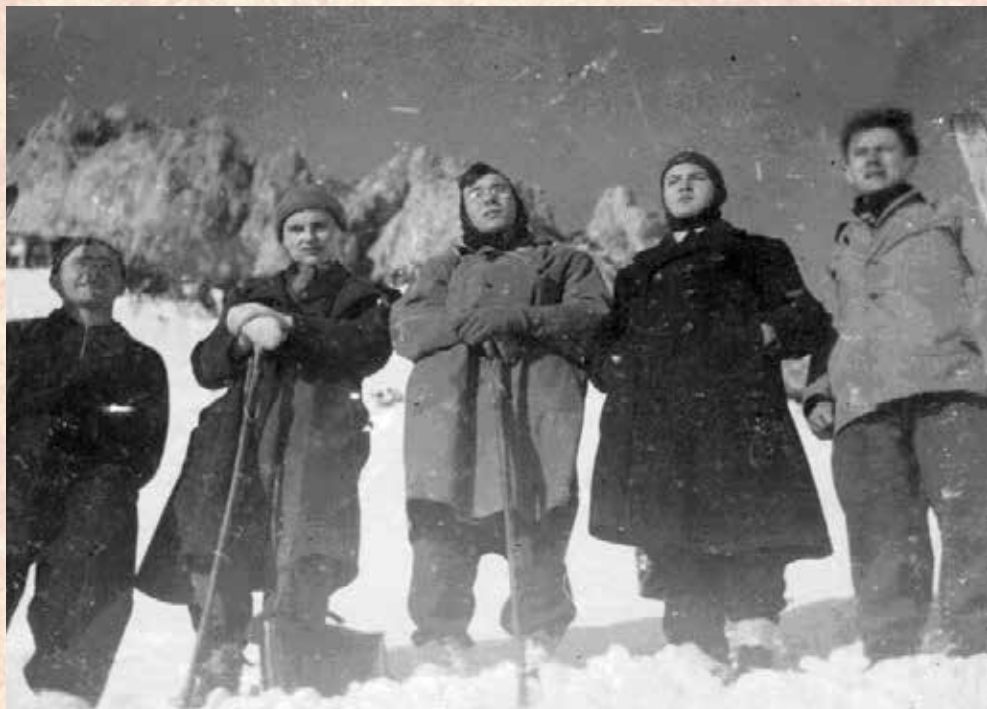
A Rax hegység tetején

Házunkból orosz kaszárnya lett. Így a noviciátust a domonkos nővéreknél folytattuk, leánykísérettel.