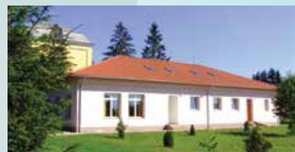
Őri István Ifjúsági Ház táborhely, ifjúsági szállás

9730 Kőszeg, Park u 1. www.szentimre.verbita.hu Wolowicz Ádám svd 06-30-280-0106