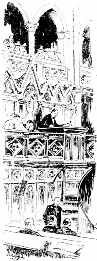
A nemzetgyűlés elnöki emelvénye.

A nemzetgyűlés két heti szünete után nyújtja be a belügyminiszter a megyei és községi választásokról szóló törvényjavaslatot. A választások eszerint még novemberben meglesznek. A virilistákat is választani fogják. A választás az általános választói jog alapján történik meg. Decemberben már megejtik a megyei tisztújításokat is: alispán- és főszolgabíróválasztásokat.