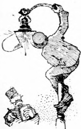
felmászik tízéert a villamoslámpára,