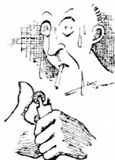
hej, pedig van öngyújtója is...