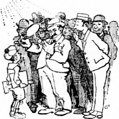
a napon nagyfűtővegen gyújt rá,