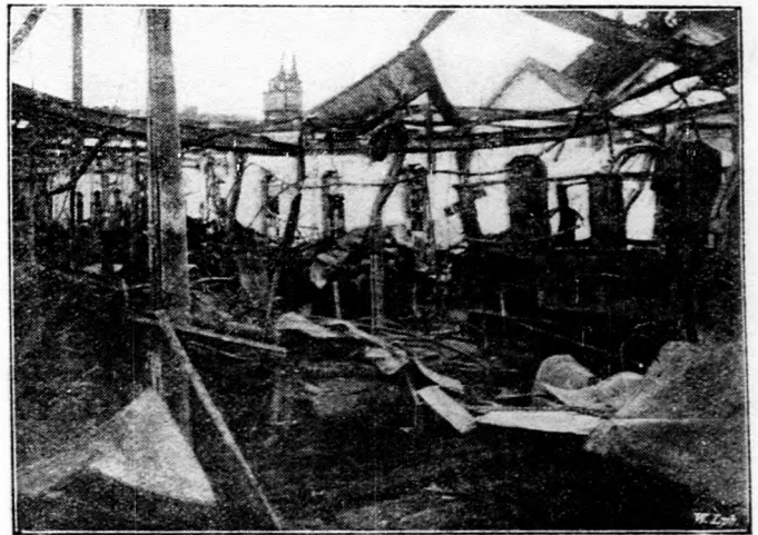
Az elmúlt héten Budapesten a Ganz-gyár Kőbányai-uti asztalosműhelyében tűz ütött ki és a műhely a lángok martaléka lett. Hatvan kész vasúti kocsis és rengeteg anyag esett áldozatul. A kár sok millióra rúg.

A FRANCIA KAMARA ELFOGADTA A TRIANONI BÉKÉRŐL SZÓLÓ JAVASLATOT. A francia kamara a trianoni békeszerződés jóváhagyásáról szóló törvényjavaslatot 478 szavazattal 74 ellenében elfogadta. Az előadó sikrasszállt a magyar határ helyességével, amely szerinte nemcsak az egyes ott élő nemzetek nyelvének történelmi hagyományait veszi tekintetbe, hanem a gazdasági szükségességeket is. A szónok szerint esetleg a helyszínen folytatott tanulmányozás felszínre hozza annak a szükségességét, hogy a szerződésben megállapított határ egyes pontjait megváltoztassák. A magyar agrárdemokrácia sok szolgálatot tehet a világbékének azzal, ha valóra váltja az agrárreformokat. Guernier jelentése befejeztével elfogadásra ajánlotta a törvényjavaslatot. Margaine képviselő felszólalásában kifejtette, hogy Magyarországon fontos gazdasági kapcsolatokat szakítottak szét. A szó-