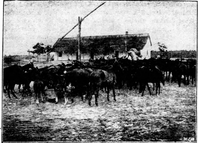
Kecskemét anyakanca állománya Bugacon.

badítjuk e folyadékokat olyképp, hogy az előbb említett sós-lé alján kigyózó csövekbe hebecsátjuk, újra kezdhető a jéggyártás folyamata.