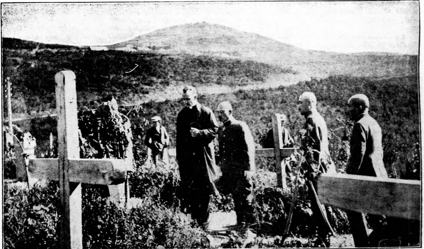
Búcsu a magyar hadifogoly-halottaktól.

Első tekintetre a fokozatosságban bizonyos méltányosságot látunk, de közelebről vizsgálva a számokat, kitűnik, hogy a méltányosságot a tervbe vett fokozatossággal alig ha lehet összeegyeztetni.