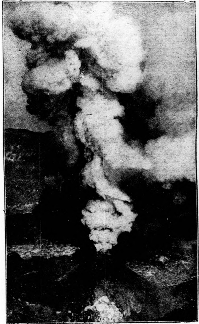
A Vezuv működés közben.

NAPOLEON KINCSE. Napoleon, amikor vesztett oroszországi hadjárata után visszavonult, Bojtis-tóban 40 millió értékűnél nagyobb összegű arany- és ezüstpénzt, ágyúkat és zászlókat sülyesztett el. A tó térképét és az elsüllyesztés helyének pontos megjelölését most a vilnai székesegyházban megtalálták. A lelet alapján a lengyel kormány bizottságot rendelt ki a kincs kiemelésére.