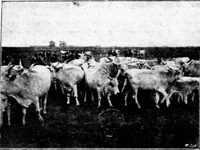
Kecskemét törzsgulyája Bugacon.