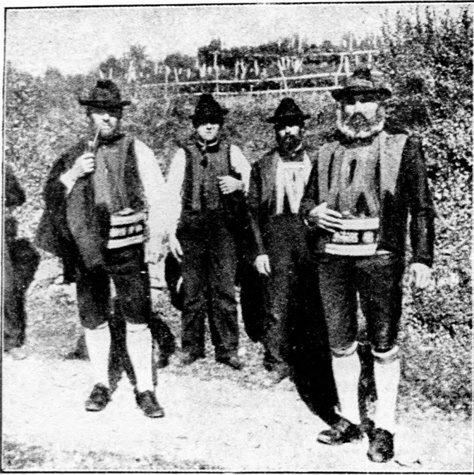
Szüretelő gazdák Felső-Olaszországban.