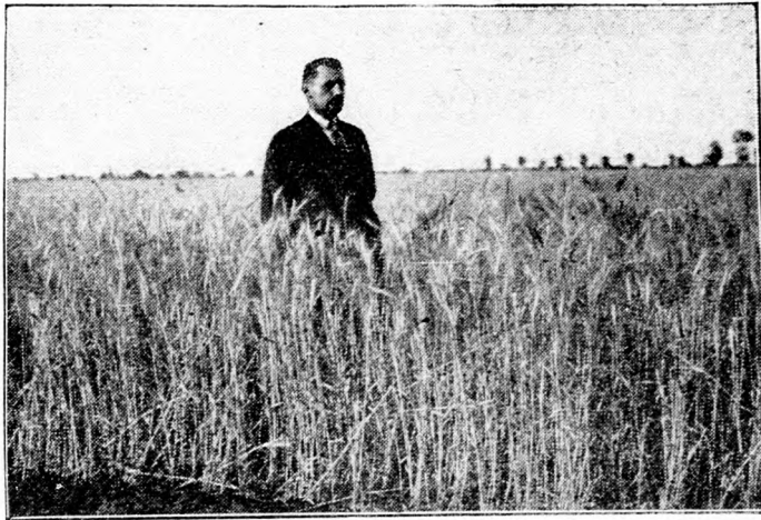
Nemesített hatvani búza kisgazda földjén.

A fogyasztó a jóminőségű pótkávétól megkívánja a jelentékeny festőképességet. Azaz ebből annyi, mint amennyit a babkávéból használunk, ugyanannyi vízzel leforrázva és kivonva, lehetőleg ugyanolyan színű kivonatot adjon. E vizes kivonat határozott és bizonyos mértékig édes ízt mutasson. Annál értékesebb, ízben minél inkább megközelíti a valódi kávéét s általában minél jobb ízű s minél több vízben is oldható táplálóanyagot tartalmaz. A jóminőségű kávépótló nincsen elégetve, nem savanyú, nem penészes. Nedvességtartalma bizonyos határon alóli (12—18%-nál csekélyebb).