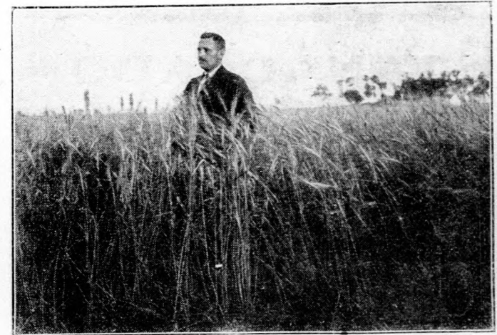
Hatvani nemesített búza a hatvani uradalom egyik tábláján.

A folyami rák. A legkeresettebb és legdrágábban vásárolt csemegéje a vagonosabb embereknek a rák, miért is kívánatos volna a köves fenekű, csendesebb folyású patakokat, úgy mint a síkság patakjait, rákkal benépesíteni és szaporulatát rendszeresen piacra hozni. A rák tudvalevőleg csigákkal, kagylókkal, férgelével, álcákkal, békákkal táplálkozik. Teljes fejlettségét 4—5 éves korban éri el. Legjobban szeret fákkal, cserjékkel benőtt, sötétebb helyeken tartózkodni, hol a sziklák alja s a fagyókerek nyujtanak neki buvóhelyet. Ezeket csak este felé hagyja el, hogy táplálékot keressen. A nőtény december elején rakja le tojásait, melyek június végén szoktak kikelni. Ha megfelelő patak folyik át földünkön és azt be akarjuk telepíteni rákkal, szerezzünk 4—5 éves rákokat a miénkhez hasonló patakból. Sohse szabad azonban hideg, hegyi patakból eredő rákot alföldre vinni, vagy megfordítva. Szállítás céljából rakjunk zöld csalánt vagy mohát fűzfa-kosárba és a csalán közé helyezzük a rákokat. Legelőszerebb a tenyésztőket szeptember végén behelyezni a patakba, hogy az októberi párosodásig új lakóhelyüket megszokhassák. Minden méter parthosszra két nőtényt és egy hímét számítsunk.