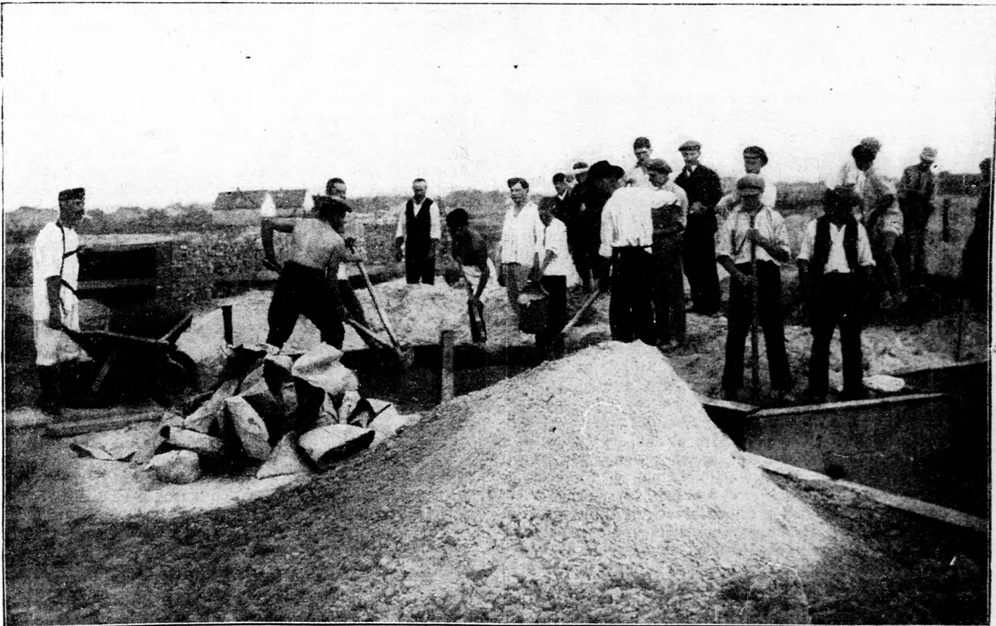
Építik a csepeli kereskedelmi kikötőt. — Csongrádi kubikosok munkában.

hetnek rá, hogy a bolsevizmus idején voltaképpen senkinek sem volt jó dolga. A népbiztosok szűkebb környezetükkel együtt dúslakoútak ugyan ételben, italban és hatalomban, de ők is elmondhatták azt, amit a fűj az iskolai versikében: «Akkor én itt jól élek, csak a vadásztól félek.» Mert az ellenforradalom réme ölte meg a hatalmon lévők idegeit, mindig remegtek, hogy elővillan valamelyik bokorból a polgárság puskacsöve s megtorlást vesz a rombolásokért és hóhérokodásokért. A hatalmon kívül szorult tömeg semmivel sem lett boldogabb. Nem egészen négy hónapi garázdálkodás után már alig volt ennivalónk, a boltok üresen meredtek ránk s a kereskedelem szerepét a csempészet és a batyuzás vette át. Elfojtották a gondolatszabadságot, a sajtónak csak azt volt szabad írnia, amit ráparancsoltak s a