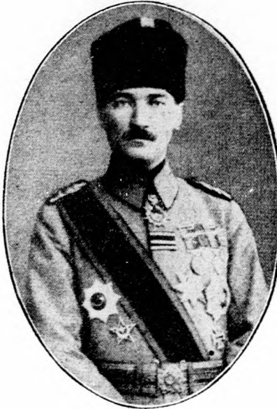
Musztafa Kemal pasa,