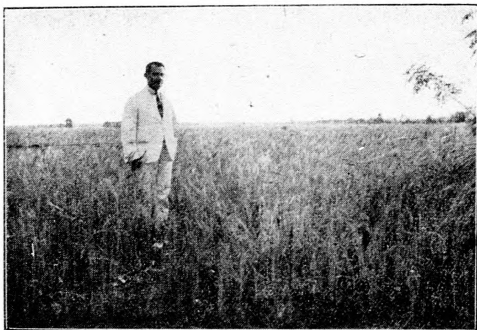
Közönséges búza kisgazda földjén.

Kiváló érdeke tehát a gazdának, hogy búzaterméseit lehető nagyra felfokozza. Ebben segítségére van a nemes vetőmag is. Tekintettel a búza kiváló fontosságára, ismét közlünk képeket annak szemléltetésére, hogy: «Ki mint vet, úgy arat.» Mind a három kép idei felvétel. Az első kép a hatvani uradalommal mesgyés oly kisgazda búzaföldjét mutatja be érés előtt, aki abba közönséges magot vetett. A második képen ugyancsak az uradalommal szomszédos, más kisgazdának buzavetése látható, aki a vetéshez nem közönséges, hanem hatvani nemesített vetőmagot használt. A harmadik képen végül nemesített hatvani búzát látunk az egyik uradalmi táblán. Míg a közönséges vetőmag után vetés felette gyenge, addig a nemes búzáé kisgazdaföldön is sokkalta jobb, míg a legfejlettebb az uradalmi táblán. Ez csak amellett szól, amit már többször elmondottunk, hogy minél bővebb termő valamely fajta, annál inkább meghálálja, ha jól megmunkált és jó trágyaerőben lévő földbe jut. Általában az uradalmi földeket jobban művelik és trágyázzák és innét van, hogy a nemes vetőmag az uradalmakban szokott