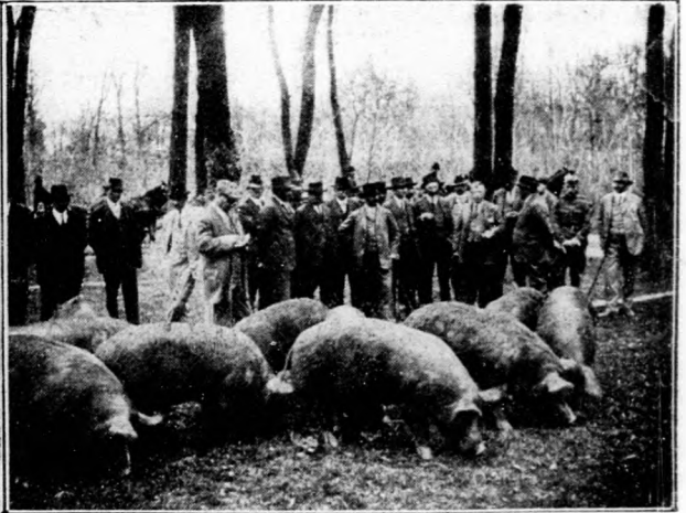
Képek a ceglédi gazdák tanulmányújáról.

Balról: Az ácsi cukorgyár megtekintése. — Jobbról: Látogatás a kisbéri állami ménes-birtokon. (Berkshire-i sertések.)