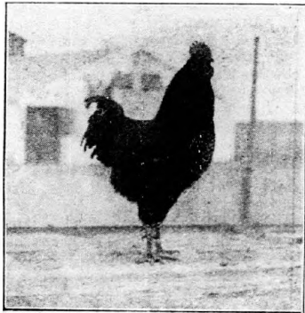
Vörös Izlandi kakas.

A rhode-island tyúk. (Képpel.) A rhode-island, vagy vörös islandi tyúkot némelyek hazánkban is tenyésztik. Északamerikából jött Európába. Testsúlya 3 kg, tehát akkora, mint a plymouth,