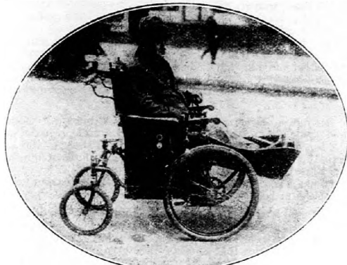
Ujrendszőr villamossal hajtott tolószék, mely Németországban használatos.