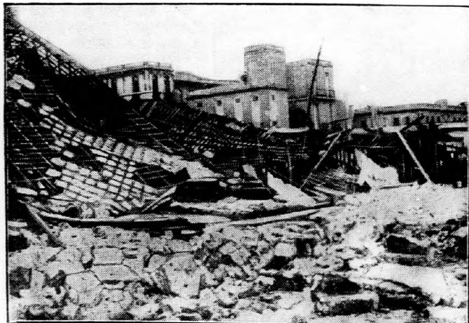
A ciklon pusztítása Kuba szigetén.

Az országtól a főváros nem maradhat el. Már az ajánlások is azt mutatják, hogy Bethlen pártja s a kor-