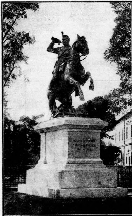
A jászberényi hősök emlékszobra,

Az ország népe függetlenítette magát az októbrista