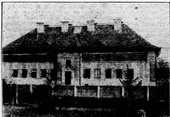
A csermajori tejgazdasági szakiskola központi épülete,

De még egy előnyös körülményt kell figyelembe vennünk.