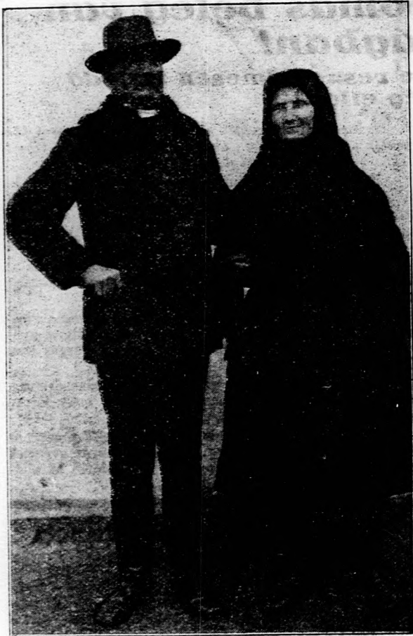
Aranymennyegzős házaspár Boldog községben.