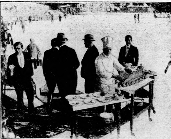
Vendéglő a jégen.

Az Orsz. Magyar Gazdasági Egyesület igazgató választmányára február 4-én, kedden délelőtt tíz órakor a Köztelek székházának nagytermében tartja ez évben az első rendes gyűlést. A gyűlés keretében az OMGE alapításának száz éves fordulóját ünneplik , valamint beszámoló tartanak az újabb mezőgazdasági vonatkozású törvényhozási és kormányintézkedésekről. A különböző beadványok és határozati javaslatok végrehajtásának letárgyalása után a cukorrépa forgalmi adójának eltörlése ügyében teendő felterjesztéssel , valamint a mezőgazdasági kiállítás előkészítésének munkálataival foglalkoznak.