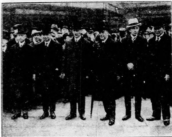
Kép a londoni leszerelési értekezlet résztvevőiről.

Balról-jobbra: Adams, amerikai tengerészeti államtitkár; Alexander, angol miniszter, az admirális első lordja; Stimson, amerikai külügyi államtitkár; Henderson, angol külügy-miniszter, Dawes tábornok, Amerika londoni nagykövete.