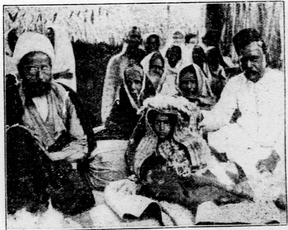
Vége az indiai gyermekházasságoknak.

Epekő, vesekő és hólyagkőbetegek, valamint azok, akik hűgysavas sók túlszaporodásában és köszvényben szenvednek, a természetes „ Ferenc József ” keserűviz használatával mellett állapotuk enyhülését érhetik el. Az orvosi gyakorlat számos kiváló férfira hosszú megfigyelés alapján megállapította, hogy a Ferenc József víz biztos és rendkívül kellemesen ható hashajtó előadásaira leutazik a fővárosi bírálóbizottság, amelynek tagjai között helyet foglal Hevesi Sándor, a Nemzeti Színház igazgatója is.